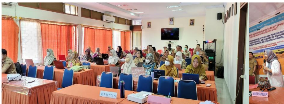
Gambar 1. Kegiatan Pelatihan Pengembangan Perangkat Pembelajaran Berbasis STEM

meningkatkan pemahaman literasi dan numerasi baik secara individu maupun kelompok. Dengan demikian sejalan dengan teori konstruktivis sosial (Slavin, 1994). Gambar 1 menunjukkan proses pendampingan dan pelaksanaan pembelajaran dengan pendekatan STEM pada materi dan topik elektronika dasar yang dilakukan oleh Tim PkM secara berkelompok.