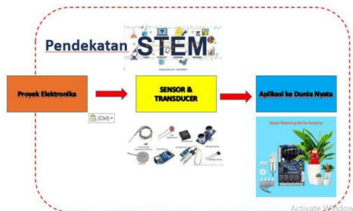
Gambar 2. Salah satu penerapan STEM dalam kegiatan pelatihan