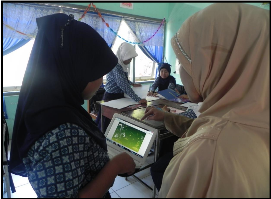
Gambar 5. Foto Siswa pada saat Konsultasi

Gambar di atas menunjukkan salah seorang siswa ketika mengkonsultasikan tugas yang akan dibuat, sedangkan siswa lainnya sibuk mempersiapkan buku gambar. Siswa diberi tugas untuk membuat gambar dekoratif secara berkelompok.