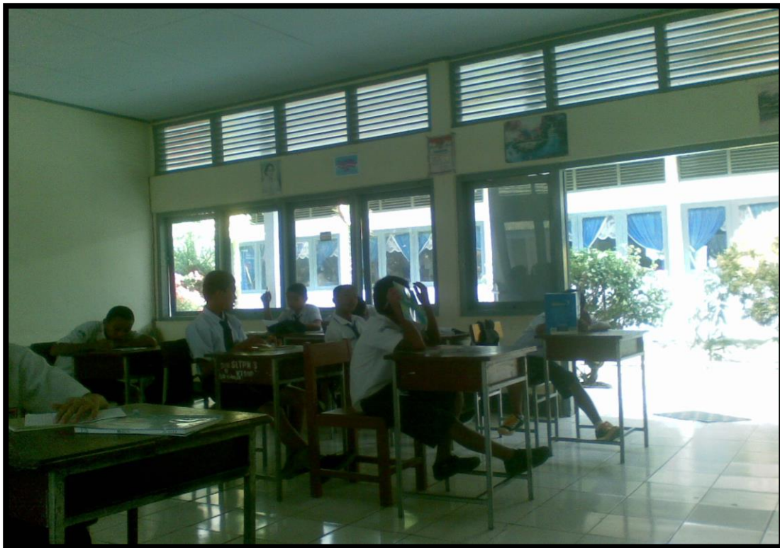
Gambar 1. Foto Proses Belajar

Foto di atas menunjukkan situasi belajar mengajar dengan metode ceramah, terlihat bahwa siswa kurang bersemangat dalam mengikuti pelajaran, beberapa dari siswa melakukan aktivitas lain selain belajar dan mendengarkan materi yang disampaikan. Hal ini juga disebabkan tempat duduk siswa yang sangat berjauhan antara siswa yang satu dengan siswa yang lainnya, sehingga siswa tidak dapat berdiskusi dengan temannya.