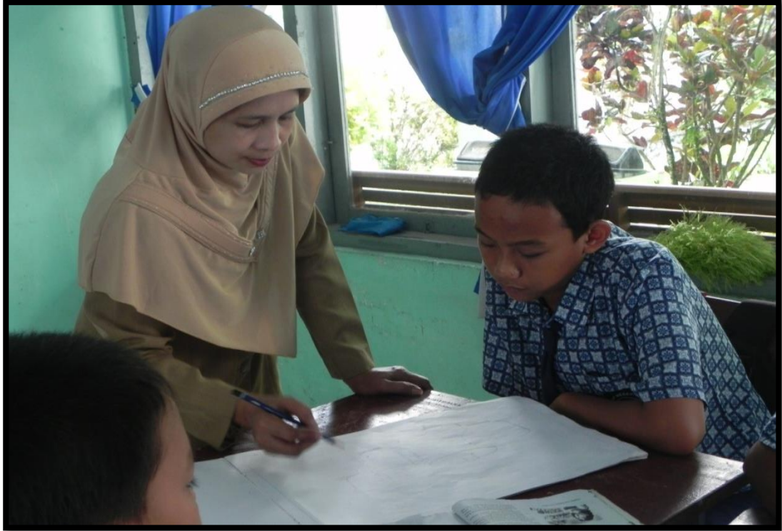
Gambar 6. Foto Guru Memberi Penjelasan

Gambar di atas merupakan gambar pada saat guru memberikan penjelasan pada salah satu siswa. Siswa diberi contoh kemudian siswa diminta untuk membuat gambar seperti yang dicontohkan.