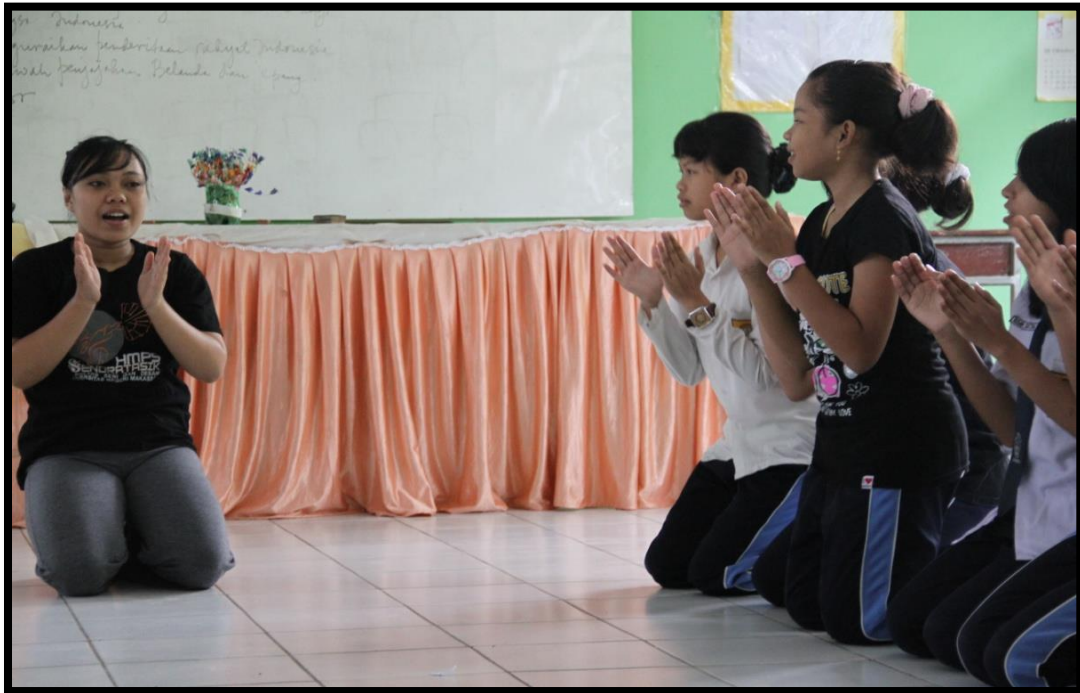
Gambar. 2 Foto praktek tari Zaman

Gambar di atas menunjukkan siswa sedang melaksanakan praktek tari di ruang kesenian yang sederhana. Siswa terlihat sangat bersemangat mempelajari tari yang sedang diajarkan. Apabila siswa mendapatkan kesulitan dalam mempraktekkan tari yang diajarkan, siswa diberi kesempatan untuk bertanya dan meminta guru untuk mengulang gerakan yang masih belum diketahui sehingga siswa dapat dengan cepat mengetahui dan menghafalkan gerakan-gerakan tari yang dipraktekkan.