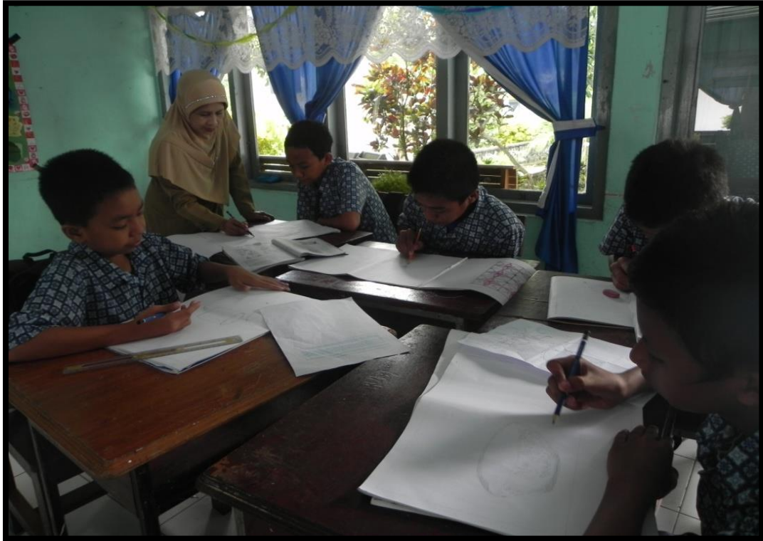
Gambar 4. Foto Praktek Menggambar (Dok.Hasrianti. 04 april 2012)

Gambar di atas adalah gambar aktifitas belajar siswa di dalam kelas. Siswa terlihat sangat bersemangat mengerjakan tugas. Bukan hanya praktek membuat bentuk dari bahan lunak saja yang digemari oleh siswa, tetapi menggambar juga sudah digemari oleh siswa. Salah satu siswa meminta bantuan kepada guru untuk diberikan contoh gambar yang akan dibuat.