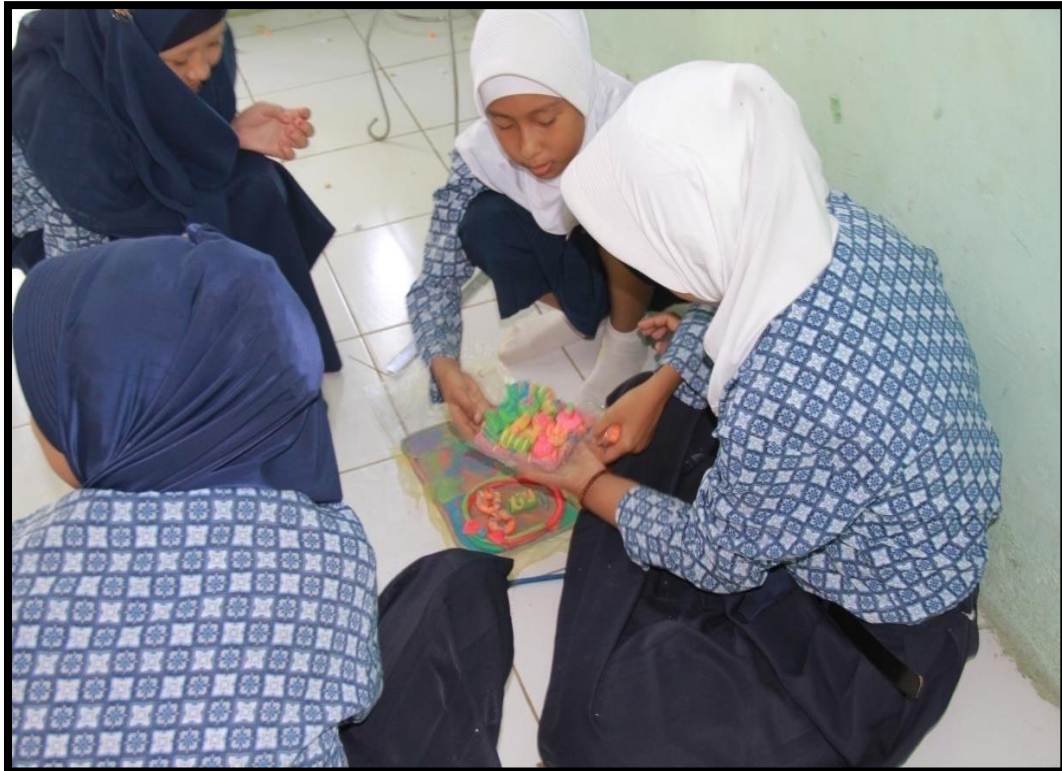
Gambar.3 Foto Praktek (seni rupa)

Gambar di atas merupakan kegiatan belajar praktek seni rupa yaitu membuat karya dari bahan lunak (plastisin). Siswa diminta untuk membuat beberapa macam bentuk misalnya bentuk bunga, buah-buahan dan sebagainya yang terbuat dari bahan plastisin. Media yang digunakan cukup membantu siswa dalam membuat suatu bentuk karya yang pada awalnya siswa tidak tertarik untuk menggunakan bahan lunak menjadi tertarik karena selain bahan dasarnya mudah ditemukan, adanya metode demonstrasi juga merupakan suatu cara untuk menarik minat siswa dalam berkarya seni rupa.