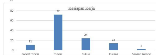
Gambar 1.4 Histogram Kesiapan Kerja

Data indikator kesiapan kerja disajikan dalam bentuk diagram seperti pada gambar 1.4 sebagai berikut