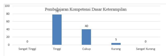
Gambar 1.1 Histogram Pembelajaran Kompetensi Dasar Keterampilan

Data indikator pembelajaran kompetensi dasar keterampilan disajikan dalam bentuk Histogram seperti pada Gambar 1.1 sebagai berikut: