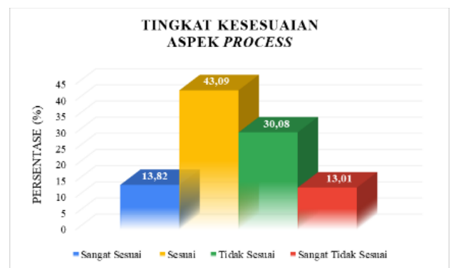
Gambar 2. Diagram Persentase Aspek Process