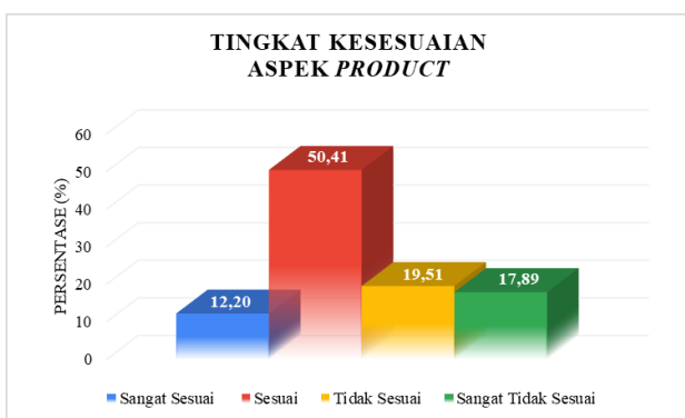
Gambar 4. Diagram Persentase Aspek Product