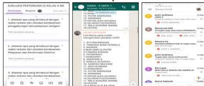
Gambar. 4 Latihan mandiri

Fase kelima peserta didik diberikan evaluasi terkait indikator pembelajaran yang yang ingin dicapai. Pemberian soal evaluasi diberikan melalui google form sebagai bentuk pelatihan lanjutan terkait materi yang diajarkan serta memberikan latihan mandiri yang dikumpulkan melalui email . Hal ini dibuktikan pada Gambar. 4 fase 5 direct instruction .