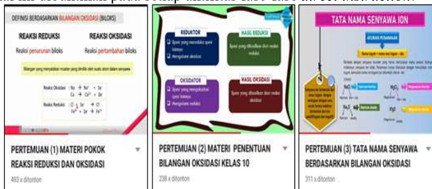
Gambar.1 Klip video youtube

Hal ini menandakan bahwa pembelajaran dengan media video memberikan hasil yang signifikan mampu meningkatkan hasil belajar peserta didik pada materi reaksi reduksi dan oksidasi. Hal ini dibuktikan pada setiap aktifitas fase-fase direct instruction .