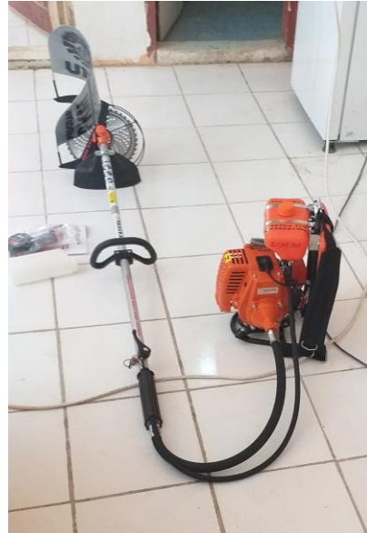
Gambar 1. Alat Pemotong Padi Termodifikasi

panen), juga mampu mengurangi kejerihan kerja; 3) Cocok untuk daerah lahan Terassering; 4) cocok untuk daerah yang mengalami kekurangan tenaga kerja panen.