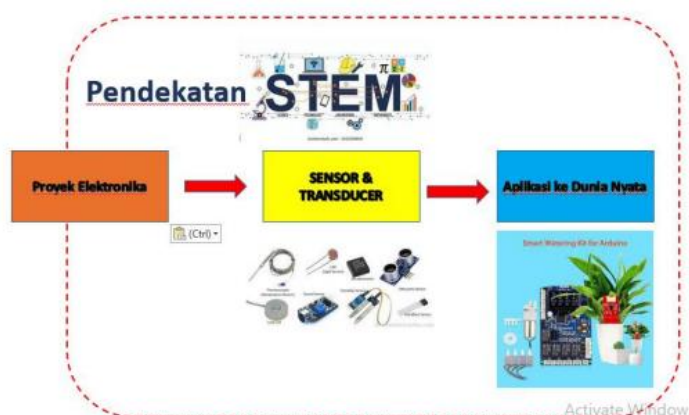
Gambar 2. Salah satu penerapan STEM dalam kegiatan pelatihan