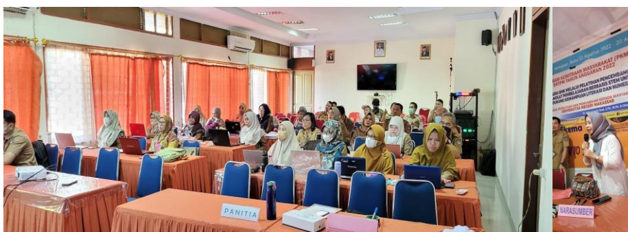
Gambar 1. Kegiatan Pelatihan Pengembangan Perangkat Pembelajaran Berbasis STEM

meningkatkan pemahaman literasi dan numerasi baik secara individu maupun kelompok. Dengan demikian sejalan dengan teori konstruktivis sosial (Slavin, 1994). Gambar 1 menunjukkan proses pendampingan dan pelaksanaan pembelajaran dengan pendekatan STEM pada materi dan topik elektronika dasar yang dilakukan oleh Tim PkM secara berkelompok.