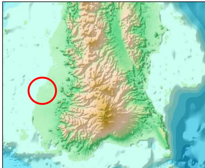
Gambar 1 Lokasi penelitian

Lokasi yang diambil dalam penelitian ini adalah Makassar yang terletak pada koordinat 5,060-5,220 LS dan 119,380-119,540 BT. Data yang digunakan dalam penelitian ini adalah data dengan rentang waktu 2017-2021 yang meliputi data curah hujan harian, data reanalisis divergence dan relative vorticity, data MJO, data anomali OLR, dan data SOI. Data curah hujan harian didapatkan dari pengamatan yang dilakukan di UPT BMKG seluruh Makassar, data reanalisis divergence dan relative vorticity didapatkan dari https://copernicus.era.5/ , data MJO didapatkan dari http://www.bom.gov.au , data anomali OLR didapatkan dari https://psl.noaa.gov , dan data SOI didapatkan dari https://data.longpaddock.qld.gov.au .