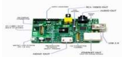
Gambar 3.1 Raspberry