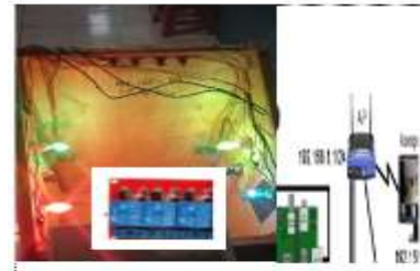
Gambar 3.3 Perangkat Alat Kendali dan monitor Lab. Berbasis Relay Raspberry.