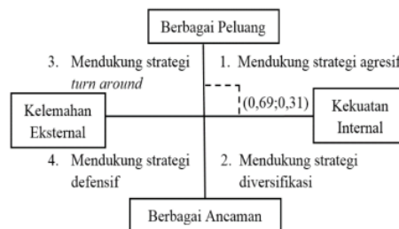
Gambar 4.3. Diagram Swot Wisata Pantai Ponnori

Terlihat dari hasil perhi 8) gan tersebut bahwa Obyek Wisata Pantai Ponnori memiliki kekuatan yang dominan dibanding kelemahannya dan peluang yang lebih besar dibanding ancamannya dengan nilai sebagai berikut :