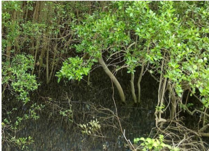
Gambar 4. Kenampak foto speies Avicennia marina

Pada gambar 4 merupakan jenis mangrove yang mendominasi sekitar PPN Untia yaitu dari jenis Avicennia marina . Untuk mangrove yang memiliki tingkat kerapatan jarang dapat ditemukan pada sekitaran tambak yang menerapkan silvofishery. Hal tersebut dikarenakan sebagai tambak hanya