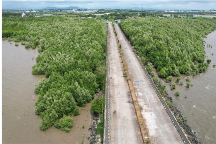
Gambar 3. Kenampak foto udara kawasan mangrove Untia

Kenampak rapatnya hutan mangrove Untia juga dapat dilihat foto udara yang diambil saat melakukan ground check. Mangrove yang memiliki tingkat kerapatan sedang dapat ditemukan pada bagian pinggir luar hutan mangrove yang berbatasan dengan laut dan juga sebagian ditemukan pada bagian yang dekat dengan daratan. Variasi kerapatan vegetasi disebabkan oleh beberapa faktor yang mempengaruhi, termasuk tindakan yang mengkonversi kawasan hutan menjadi tambak atau faktor alam (Fahreza et al., 2022).