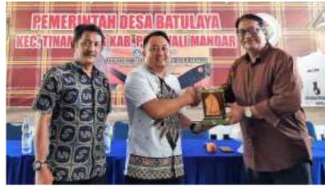
Gambar 1. Pembukaan PKM terpadu oleh Kepala Desa Batulaya dan Didampingi oleh Ketua Prodi Manajemen FEB UNM beserta Perwakilan Tim Pengabdian

Terkait industri dan/atau dunia pariwisata, penguasaan bahasa Inggris bagi penduduk setempat menjadi sebuah keidealan dalam mendukung dunia pariwisata, tanpa terkecuali di Desa Batulaya. Pun, sektor industri pariwisata juga mampu memberikan dampak positif yang terbilang signifikan terhadap pengembangan potensi ekonomi kreatif di "gelombang ekonomi baru" yang berlangsung hingga saat ini. Bahasa Inggris sebagai bahasa dunia menjadi sebuah persyaratan bagi desa wisata internasional sehingga keterampilan berbahasa Inggris akan memberikan peluang bagi desa Batulaya untuk menjadi tujuan destinasi internasional yang mumpuni, serta mampu memberikan stimulus pada penciptaan lapangan kerja baru serta kesejahteraan dan lainnya. Terampil dalam berkomunikasi menggunakan bahasa Inggris dapat memberikan nilai tambah dan nilai ekonomis pada umumnya bagi pengembangan pariwisata desa Batulaya, serta bagi para pelaku usaha mikro kecil menengah (UMKM) pada khususnya. Dengan keterampilan tersebut, UMKM mampu dan terampil menjelaskan terkait informasi pariwisata desa Batulaya yang diperlukan oleh para pengunjung dari luar negeri seperti promosi dan lain-lain, sehingga membuat para pengunjung tersebut lebih tertarik dan termotivasi melakukan kunjungan ke desa Batulaya, Kecamatan Tinambung, Kabupaten Polewali Mandar, Provinsi Sulawesi Selatan.