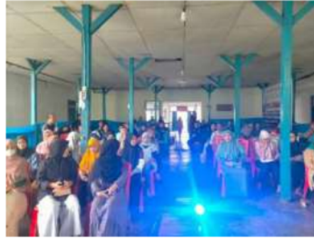
Gambar 4. Antusiasme para peserta PKM Peningkatan Mutu UMKM Pariwisata Ekonomi Kreatif melalui Program Short Course of Basic English for Marketing

mandiri berbasis ekonomi kreatif serta menjadi tujuan destinasi wisata nasional maupun internasional.