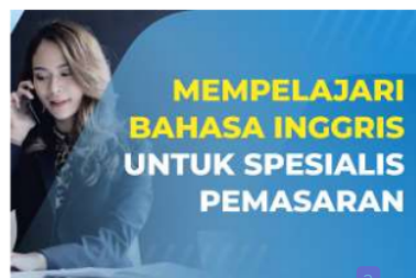
Gambar 7. Salah Satu Materi Kegiatan PKM Program Short Course of Basic English for Marketing