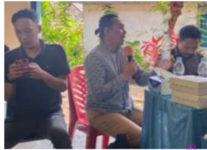
Gambar 6. Pemateri memaparkan pelatihan PKM Program Short Course of Basic English for Marketing

Waktu Pelaksanaan kegiatan pengabdian ini berlangsung selama 2 hari yaitu pada tanggal 13 dan 14 Agustus 2022 dengan jumlah 100 orang peserta, di mana puncak kegiatan dilakukan pada tanggal 14 Agustus 2022.