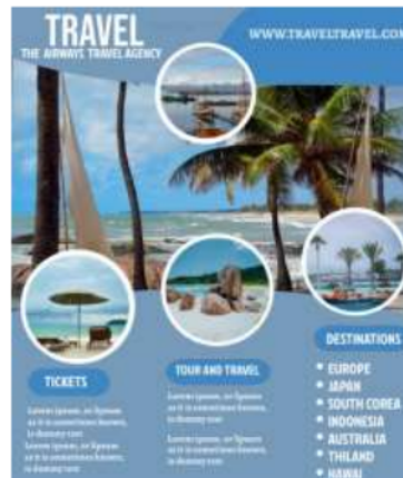
Gambar 8. Salah Satu Hasil Pelatihan Bahasa Inggris untuk Pemasaran melalui Media Flyer

Persiapan kegiatan ini berupa penyediaan sarana presentasi serta pembuatan modul penyuluhan dan pelatihan. Modul penyuluhan berisi materi dasar tentang manfaat Bahasa Inggris Dasar untuk Pemasaran, teknik serta keterampilan dalam berbahasa Inggris untuk pemula, dan praktek serta