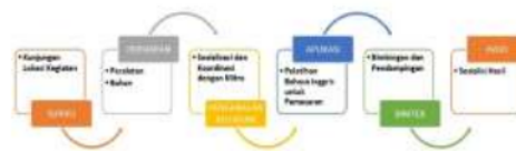
Gambar 5. Alur PKM Peningkatan Mutu UMKM Pariwisata Ekonomi Kreatif melalui Program Short Course of Basic English for Marketing

Melalui pelatihan dan pemahaman atas materi yang dipaparkan, tim pengabdian berharap para pelaku usaha / UMKM, khususnya yang berkecimpung di industri pariwisata ekonomi kreatif di Desa Batulaya terampil dalam mempraktekkan Bahasa Inggris untuk Pemasaran. Dengan meningkatnya keterampilan bahasa Inggris, masyarakat Desa Batulaya akan ikut serta berkontribusi demi terwujudnya desa Batulaya sebagai desa wisata mandiri berbasis ekonomi kreatif serta menjadi tujuan destinasi wisata nasional maupun internasional.