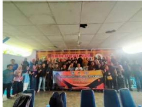
Gambar 2. Berpose bersama Mitra PKM

Dengan meningkatnya keterampilan bahasa Inggris, para pelaku usaha / UMKM serta masyarakat akan dapat ikut berkontribusi demi terwujudnya desa Batulaya sebagai desa wisata mandiri berbasis ekonomi kreatif yang mampu mengembangkan diri dan menjadi tujuan destinasi wisata nasional maupun internasional. Pemerintah Desa juga menjadi aset penting sebagai motivator yang mendukung penuh pelaksanaan kegiatan pelatihan Bahasa Inggris untuk Pemasaran. Sebagai tambahan, terkait aset dalam pengabdian ini adalah ketua tim peneliti sebagai tenaga ahli pengajar bahasa Inggris yang juga dapat menjadi fasilitator dalam pelaksanaan pelatihan Bahasa Inggris untuk Pemasaran.