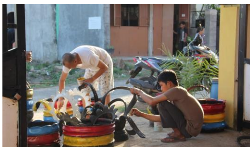
Gambar 11. Proses Pengecatan Hasil Olahan Ban Bekas Pemuda Antang