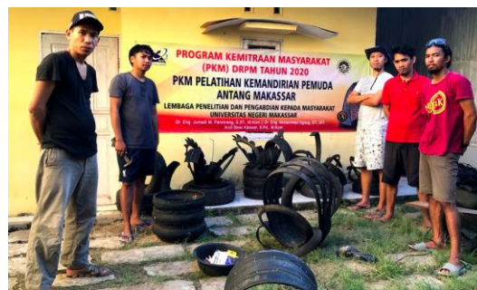
Gambar 6. Foto Bersama Tim Inti Mitra Pemuda Antang