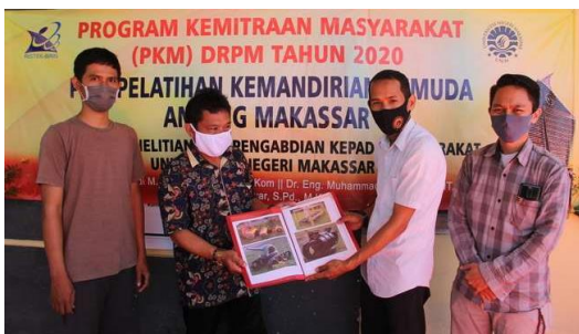
Gambar 15. Serah Terima Pola/Contoh Olahan dan Buku Panduan Step by Step ke Ketua RT