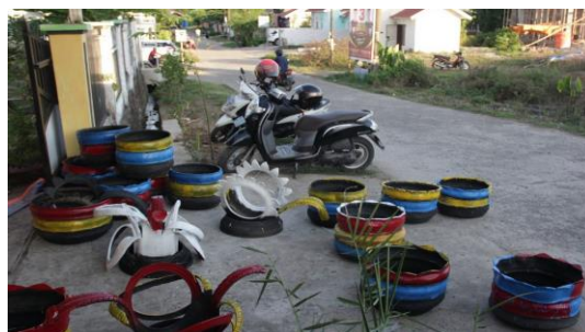
Gambar 12. Beberapa hasil Produk Pemuda yang siap digunakan