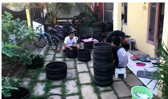
Gambar 5. Melatih ketua Mitra Pemuda Antang Training for Trainer

komputer. Sebagai dosen pengampuh mata kuliah kewirausahaan digital pada prodi Teknik komputer di Universitas Negeri Makassar, tim akan terjun langsung untuk membuat modul pelatihan penggunaan aplikasi google my business, pelatihan cara pembuatan website sederhana, cara membuat akun media sosial untuk bisnis, cara membuat konten digital, cara membuat video tutorial untuk kebutuhan promosi dan pembelajaran di Youtube.