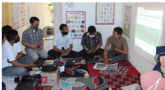
Gambar 16. Penutupan Kegiatan Pelatihan oleh Ketua RT setempat