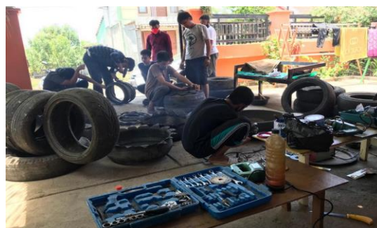
Gambar 8. Proses Pelatihan Pemuda Antang