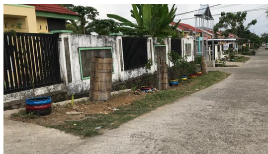
Gambar 14. Setelah Impelemntasi bersama Pemuda Antang