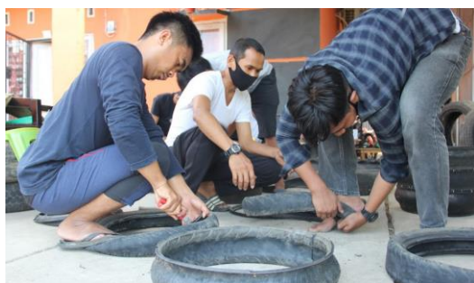
Gambar 7. Melatih Warga Mengolah Ban Bekas