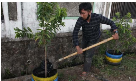
Gambar 13. Memasang langsung Pot Hasil Pemuda Antang