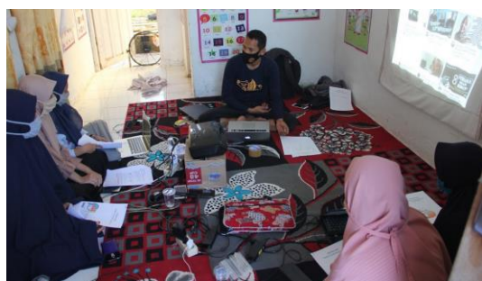
Gambar 9. Pembekalan Materi Kewirausahaan Pemuda Antang