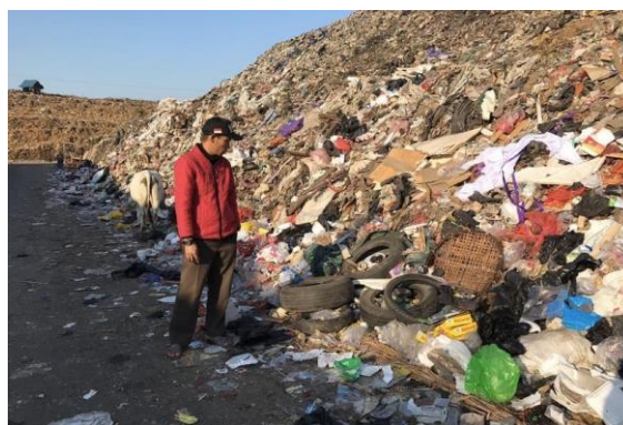
Gambar 2. Survei Lokasi ke TPA Antang Untuk Melihat Ketersediaan Bahan Baku