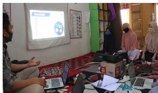
Gambar 10. Pelatihan Materi Konten Digital Pemuda Antang