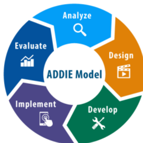
Gambar 1 Model penelitian ADDIE

Jenis penelitian yang digunakan dalam penelitian ini yaitu jenis penelitian pengembangan atau Research and Development (R&D). Dalam penelitian ini, peneliti menggunakan model pengembangan ADDIE, adapun tahap-tahap yang akan dilakukan dalam penelitian pengembangan yaitu meliputi tahap analisis (Analyze), tahap desain (Design), dan tahap pengembangan (Develop). Implementasi, dan evaluasi