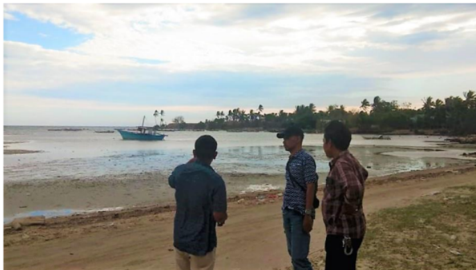
Gambar 1 : Observasi pantai wisata dan budidaya rumput laut.

Kegiatan pelatihan Penguatan Jiwa Kepemimpinan dan Kewirausahaan Pada Organisasi Karang Taruna Desa Mallasoro, Kecamatan Bangkala, Kabupaten Jeneponto untuk memberikan wawasan kepada para pemuda Karang Taruna, yang dilakukan oleh team pengabdian Prodi Manajemen Universitas Negeri Makassar. Kegiatan dilaksanakan terhadap para pemuda Karang Taruna di Balai Desa Mallasoro. Kegiatan ini diawali dengan observasi yang dilakukan oleh tim pengabdian tersebut di mulai dari bulan Juni 2018 untuk mengumpulkan informasi, menganalisa masalah dan mengidentifikasi segala yang berkaitan dengan Karang Taruna. Dari hasil observasi yang dilakukan oleh tim pengabdian menyimpulkan bahwa dibutuhkan pelatihan mengenai pengenalan kepemimpinan dalam kewirausahaan.