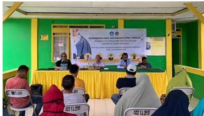
Gambar 3 : Pemaparan materi oleh Tim Pengabdian

Proses pelatihan berlangsung dengan lancar karena antusias yang luar biasa dari peserta para pemuda Karang Taruna dan juga warga masyarakat lainnya. Suksesnya kegiatan ini juga tidak lepas dari bantuan kepala desa yang sangat mendukung dilaksanakannya pelatihan ini. Dengan kerja sama yang baik antara tim pengabdian, peserta Karang Taruna, dan dukungan dari kepala desa maka pelatihan berjalan dengan sukses, tim abdimas bisa menjalankan tugasnya memberikan pelatihan, dan bagi para peserta pelatihan mendapatkan penambahan wawasan baru mengenai