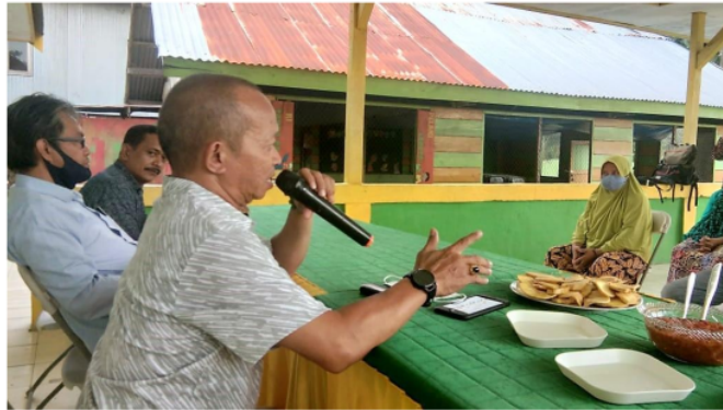
Gambar 2 : Sambutan Kepala Desa Mallasoro

Kemudian tim pengabdian menyiapkan beberapa materi yang disesuaikan dengan kebutuhan para pemuda Karang Taruna Desa Mallasoro, Kecamatan Bangkala, Kabupaten Jeneponto, yaitu : 1) Peningkatan Jiwa Kepemimpinan dalam Berwirausaha; 2) Cara Sukses Berwirausaha di Usia Muda; dan 3) Beberapa Ide Bisnis di Desa. Setelah materi siap maka dilakukan pelatihan/sosialisasi mengenai kepemimpinan dalam kewirausahaan.