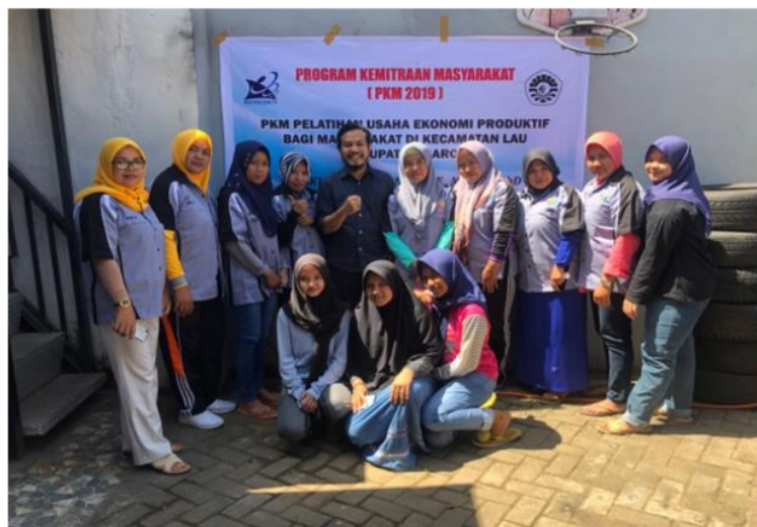
Gambar 3. Foto bersama