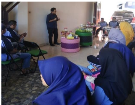
Gambar 2. Pelaksanaan pelatihan

Pelatihan diberikan dalam bentuk ceramah yang dilanjutkan dengan eksperimen langsung dan tanya jawab (Sugiyono, 2006; Miles & Huberman, 1994). Materi yang disampaikan adalah wirausaha dan peluang usaha rumahan, prinsip dasar pembuatan produk, pengemasan dan pemasaran produk, khususnya produk sabun dan deterjen. Praktek cara pembuatan pembuatan deterjen, sabun cuci tangan, sabun cuci piring serta pelembut dan pewangi pakaian. Warga dibagi ke dalam beberapa kelompok, kemudian dengan dibimbing Tim pengabdian mempraktekkan sendiri pembuatan produk tersebut yang disajikan pada Gambar 2.