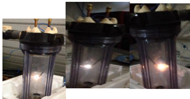
Table 2. Hasil Pengujian Campuran Refrigeran dengan komposisi berkisar 33,85% R-134a + 66,15% R-600a