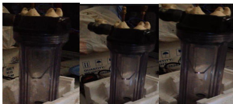
Gambar 3. Hasil Pengujian Campuran Refrigeran dengan komposisi berkisar 50,79% R-134a + 49,21% R-600a