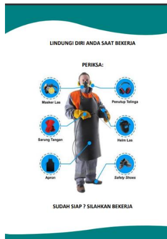
Gambar 2. Kelengkapan K3