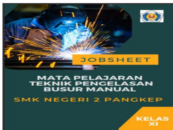
Gambar 1. Cover Job Sheet

Penelitian dan pengembangan yang dilakukan bertujuan untuk menghasilkan sebuah produk job sheet sebagai media pembelajaran yang memenuhi kriteria valid, praktis, efektif dan mengacu pada tuntutan KI dan KD Kurikulum 2013 revisi 2016 yaitu berdasarkan Peraturan Direktur Jenderal Pendidikan Dasar dan Menengah No. 464/D.D5/KR/2018 tahun 2018 tentang Kompetensi Inti dan Kompetensi Dasar Mata Pelajaran Muatan Nasional (A), Muatan Wilayah (B), Dasar Bidang Keahlian (C1), Dasar Program Keahlian (C2), dan Kompetensi Keahlian (C3). Penelitian ini menghasilkan job sheet Teknik Pengelasan Busur Manual. Tahap penulisan naskah job sheet ini terdiri dari cover, gambar kelengkapan K3 dan kegiatan belajar yang terdiri dari 8 kegiatan.