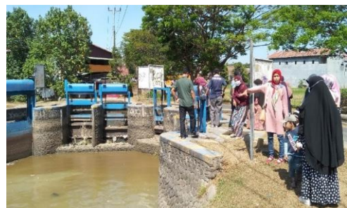
Gambar 4. Observasi pintu air dan petak tersier

Setelah pemberian materi oleh tim pelaksana kegiatan, selanjutnya dilaksanakan kunjungan pada lokasi pada Daerah Irigasi Kampili, Daerah Irigasi Bissua, dan Daerah Irigasi Bili-bili. Ketiga daerah irigasi tersebut mendapatkan suplay air dari sungai Jeneberang yang melintasi Kabupaten Gowa dan Kota Makassar. Pada sungai Jeneberang ini pula terletak Bendungan Bili-bili yang berada di hulu ketiga bending tersebut di atas.