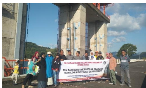
Gambar 6. Observasi Bangunan Bendungan Bili-bili

Kegiatan pada hari berikutnya adalah kunjungan pada bangunan utama jaringan irigasi, yakni Bendung Kampili, Bendung Bissua, Bendung Bili-bili, dan Bendungan Bili-bili. Pada Gambar 5 adalah kegiatan kunjungan pada Bendung Kampili. Pada lokasi ini, peserta dijelaskan berbagai hal mengenai bendung, bagian utama dan pelengkap dari bendung, hingga kondisi yang terjadi di lokasi