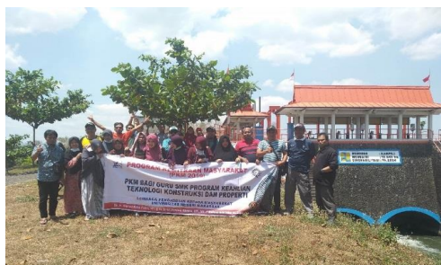
Gambar 5. Observasi Bangunan Bendung Kampili

saluran tersier. Saluran sekunder yang mendapat suplai air dari BL.14 yaitu saluran sekunder Kalukuang, saluran sekunder Majannang, dan saluran sekunder Doang. Selain itu, air irigasi juga masih berlanjut pada saluran primer limbung hingga mencapai BL. 17.