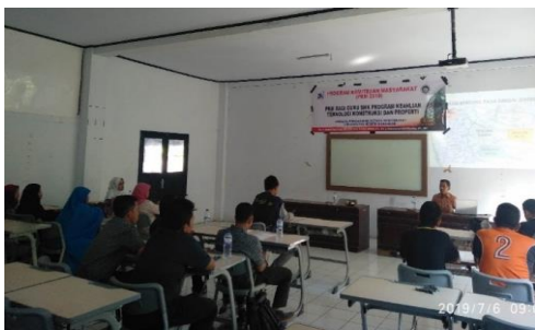
Gambar 1. Pemberian pre-test dan materi pelatihan

Hasil survey menunjukkan bahwa peserta yang mengikuti kegiatan ini adalah dominan belum mengikuti Pendidikan profesi guru, namun dominan dari mereka telah mengikuti pelatihan penerapan Kurikulum 2013. Namun demikian, penerapan pembelajaran spektrum SMK 2016 terutama terkait dengan pembelajaran yang menerapkan High Order Thinking Skill (HOTS) memang diharapkan berlaku sejak adanya revisi kurikulum 2013 (Armiwati et al. 2019).