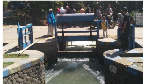
Gambar 3. Observasi bangunan utama dan bangunan pelengkap irigasi

Selain itu, peserta juga merasa butuh akan materi tersebut sehingga proses tanya jawab berlangsung secara terus menerus.