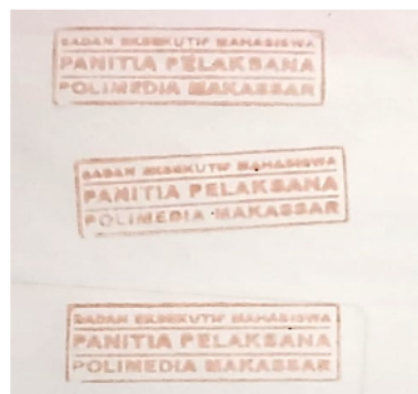
Gambar 3. Hasil teraan tinta stempel dari EDBM pada kertas.

yang terdapat pada EDBM yaitu senyawa antosianin. Antosianin merupakan pigmen warna yang memiliki muatan positif yang dikenal dengan ion flavium. Keberadaan ion flavium dalam larutan menyebabkan keluarnya warna merah pekat dari EDBM dan stabil dalam suasana asam. Menurut Celli & Brooks, (2017), kestabilan antosianin dipengaruhi oleh kondisi pH dan suhu dalam larutan serta kondisi penyimpangannya. Hal ini dipertegas oleh Adam, (2017) yang menyatakan bahwa antosianin stabil pada pH 1-3 karena pada kondisi pH asam tersebut antosianin berada dalam bentuk ion flavium dan stabil pada suhu 60° karena degradasi warna mencapai 25,14% serta stabil dalam penyimpanan suhu lemari es (±4°C) dengan persentase degradasi 4,91%. Struktur antosianin dalam bentuk ion flavium ditampilkan pada Gambar 4.