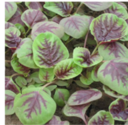
Gambar 1. Daun Bayam Merah Segar Tipe Varietas Red Leaf ( Amaranthus mangostanus L. ) (Han & Xu, 2014; Pebrianti et al., 2015).

Proses pembuatan tinta stempel dilaksanakan di laboratorium Politeknik Negeri Media Kreatif PSDKU Makassar dan proses pengujian tinta stempel dilakukan di Lab. Kimia Universitas Negeri Makassar. Bahan yang digunakan adalah daun bayam merah tipe varietas Red leaf sebanyak 680 gram yang diperoleh dari Kelompok Wanita Tani Makkareso Sumbang binaan Dinas Ketahanan Pangan Kab. Enrekang, senyawa pengkompleks NaOH pro analisis, etanol teknis, gliserin, gum arab, larutan Curcuma longa , dan aquabides. Peralatan yang digunakan adalah crusher (penghalus bayam), magnetic stirrer, peralatan gelas, stempel dan bantalan stempel. Alat uji kerapatan, viskositas Oswald dan pipa kapiler.