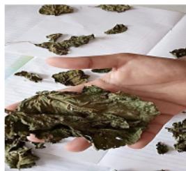
Gambar 2. Daun bayam merah kering hari ke-9.