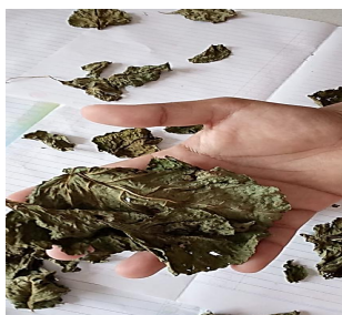
Gambar 2. Daun bayam merah kering hari ke-9.