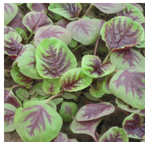
Gambar 1. Daun Bayam Merah Segar Tipe Varietas Red Leaf ( Amaranthus mangostanus L. ) (Han & Xu, 2014; Pebrianti et al., 2015).

Proses pembuatan tinta stempel dilaksanakan di laboratorium Politeknik Negeri Media Kreatif PSDKU Makassar dan proses pengujian tinta stempel dilakukan di Lab. Kimia Universitas Negeri Makassar. Bahan yang digunakan adalah daun bayam merah tipe varietas Red leaf sebanyak 680 gram yang diperoleh dari Kelompok Wanita Tani Makkareso Sumbang binaan Dinas Ketahanan Pangan Kab. Enrekang, senyawa pengkompleks NaOH pro analis, etanol teknis, gliserin, gum arab, larutan Curcuma longa , dan aquabides. Peralatan yang digunakan adalah crusher (penghalus bayam), magnetic stirrer , peralatan gelas, stempel dan bantalan stempel. Alat uji kerapatan, viskositas Oswald dan pipa kapiler.