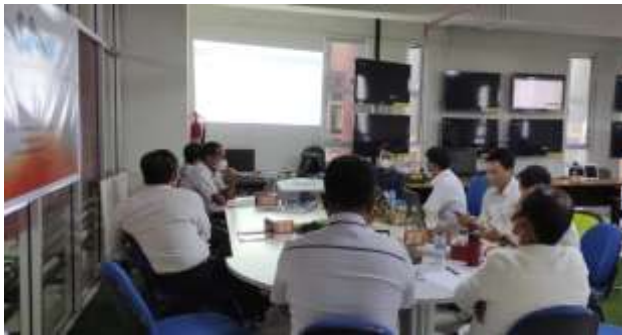
Gambar 1. Perkenalan OJS 3

ini meliputi pengenalan tampilan OJS 3, pengenalan menu-menu pada OJS 3 hingga tahapan-tahapan manajemen jurnal di OJS 3, pengenalan tersebut di paparkan berdasarkan akses login dari level user mulai dari Site Administrator, Journal Manager, Reader, Author, Editor, Section Editor dan Reviewer. Tujuan dari kegiatan ini agar mitra memperoleh gambaran umum tentang manajemen jurnal di OJS 3.