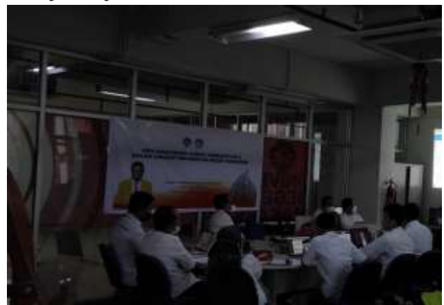
Gambar 3. Pendampingan dan pelatihan manajemen jurnal pada OJS 3

Pada tahapan ini, tim pengabdian melatih dan mendampingi mitra dalam penggunaan OJS 3. Dimulai dari tahap pembuatan akun hingga manajemen jurnal di OJS 3.