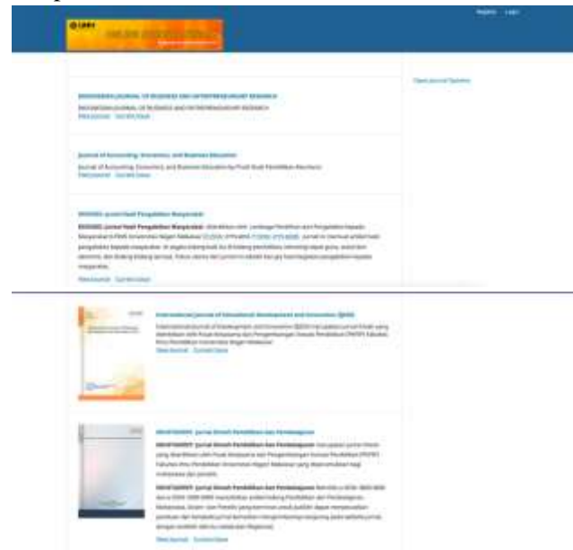
Gambar 5. Tampilan halaman utama jurnal UNM Versi OJS 3

Secara default, Open Journal Systems diinstal dengan antarmuka pengguna yang sangat sederhana dan fungsional. Ini termasuk header atas, bilah navigasi, blok navigasi ke kanan, dan blok konten utama di tengah halaman. Gambar berikut adalah tangkapan layar halaman utama Jurnal OJS Universitas Negeri Makassar setelah diupgrade oleh tim peneliti.