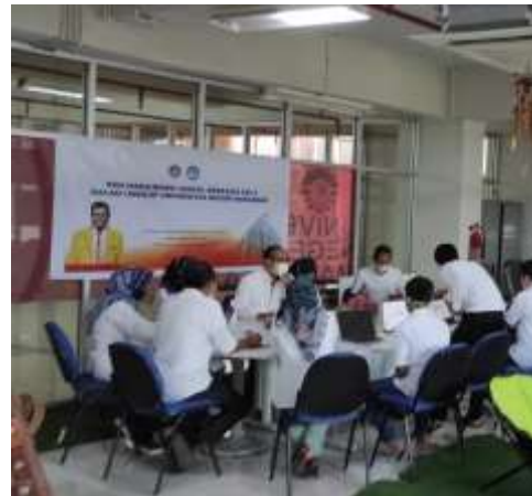
Gambar 2. Pemberian Materi tahapan-tahapan manajemen jurnal pada OJS 3

Setelah mitra memahami tahapan-tahapan manajemen jurnal pada OJS 3 maka dilanjutkan dengan pendampingan penggunaan OJS 3 pada mitra.