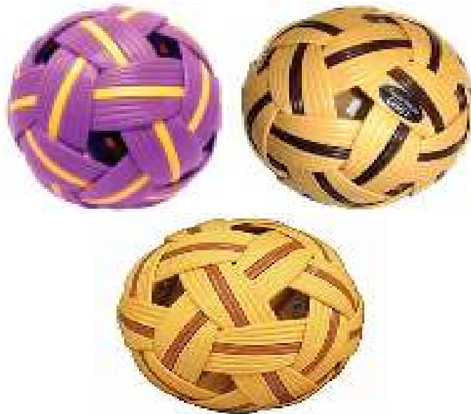
Gambar 2.4. Bola Sintetis

Seri bola NETPRO™ dimulai dengan bola pemula yang sangat ringan dan bahan sintetisnya sengaja longgar serta dibuat dari bahan yang lebih tipis dan lunak (hingga) lebih lunak saat ditendang atau disundul). Meskipun bola pemula tersebut bisa digunakan untuk semua umur, bahkan anak TK sekalipun, bola tersebut paling sesuai bagi anak kelas 5-6 ke atas, usia saat biasanya mereka dikenalkan pada Sepak takraw di sekolah. Setiap seri bola dengan tingkatan lebih tinggi, berakhiran Pro untuk putra, lebih berat daripada seri sebelumnya (memberikan kontrol bola lebih) dan garis sintetisnya lebih tebal, keras, dan dianyam lebih ketat, lebih keras saat kontak dengan tubuh, namun lebih elastis (membuat permainan lebih cepat), yang membuat pemain berpengalaman lebih menyukainya.