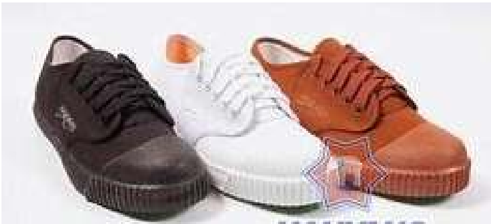
Gambar 2.1 Foto sepatu

Baik tim putra maupun putri wajib mengenakan celana pendek dan kaus atau T-shirt berlengan. Pemain juga harus memasukkan kausnya, yang bernomor punggung dari 1 - 5. Kapten regu mengenakan ban kapten yang dilingkarkan di lengan kirinya. Pemain tidak diperkenankan mengenakan pakaian apa pun yang bisa membahayakan pemain lawan.