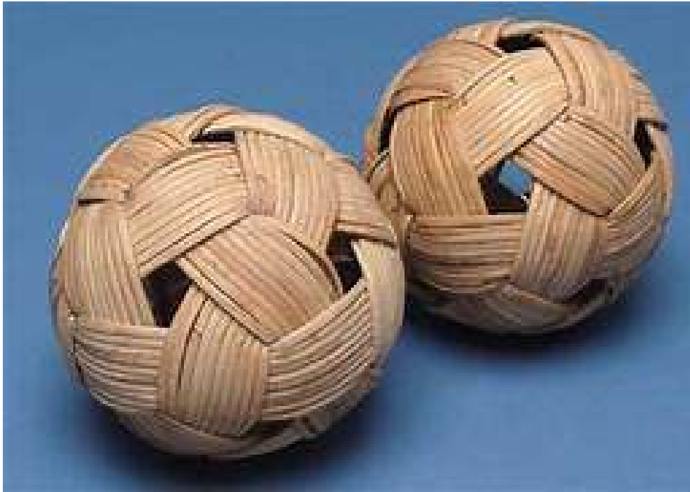
Gambar 2.3. Bola takraw terbuat dari rotan

dari bahan sintetis, dengan bentuk yang sama dengan bola rotan serta masih tetap dianyam dengan tangan.