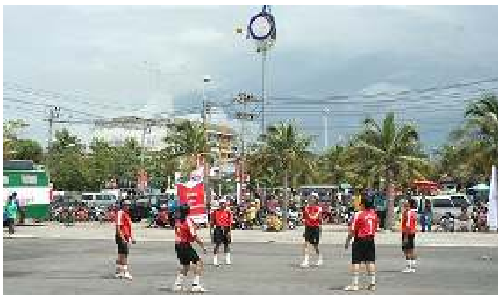
Gambar 8.1. Permainan Sepak Takraw Hoop

Hoop yang digantung dengan seutas tali yang diikatkan pada sebuah katrol dan ditambatkan di pengait dengan panjang tali yang terjulur tidak boleh kurang dari 50 cm, atau 19 \frac{3}{4} inci dibagian atas lingkaran hoop.