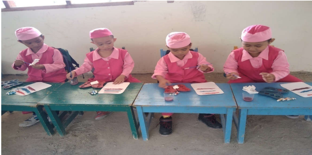
Anak memperlihatkan hasil pencampuran warnanya dan menyebutkan nama warna serta kategori yang masuk pada warna primer dan sekunder