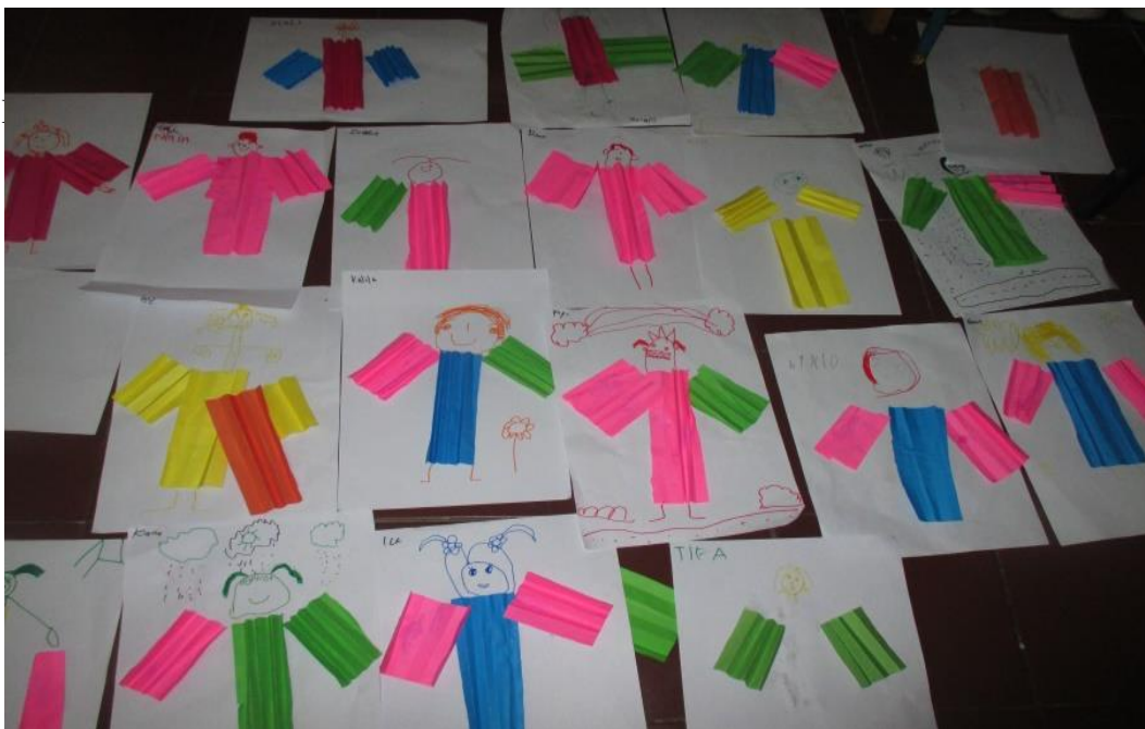
Hasil Karya Anak