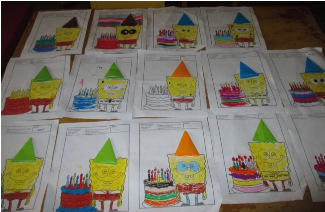
Hasil Karya Anak