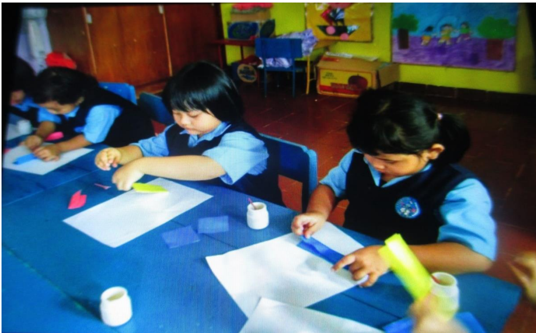
Pelaksanaan Melipat Kertas