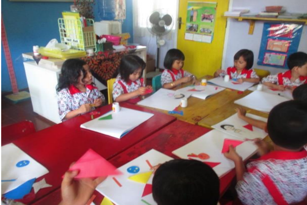
Pelaksanaan Kegiatan Melipat Kertas Bentuk Segitiga