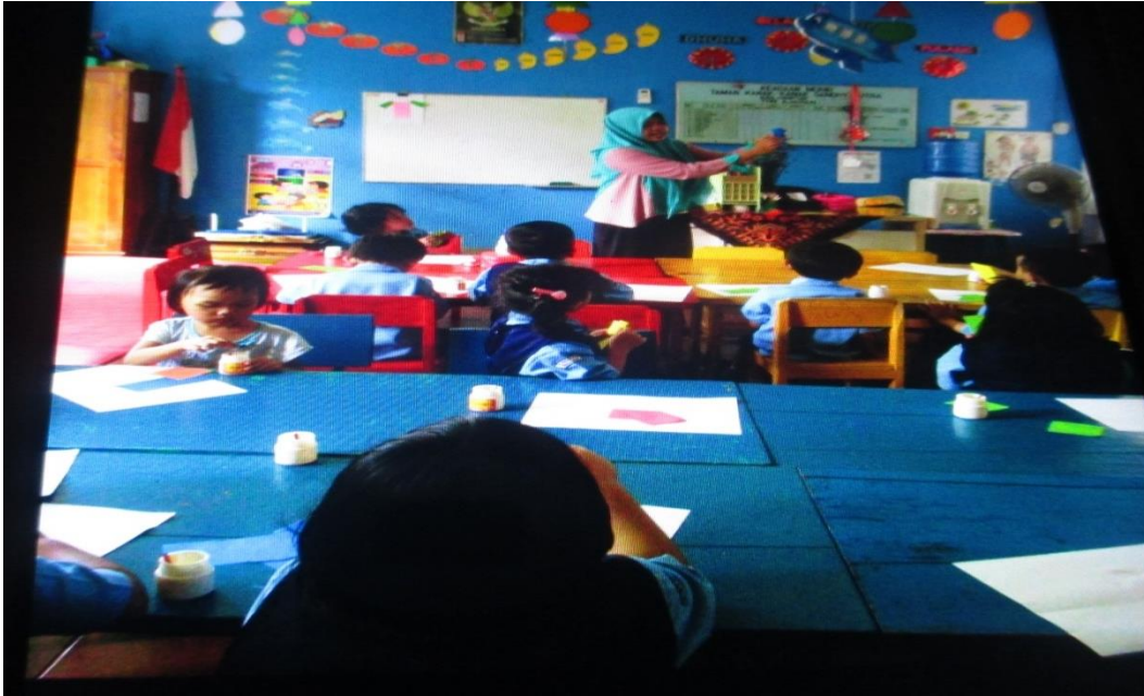
Guru Menjelaskan Kepada Anak Kegiatan Melipat Yang Akan Dilakukan