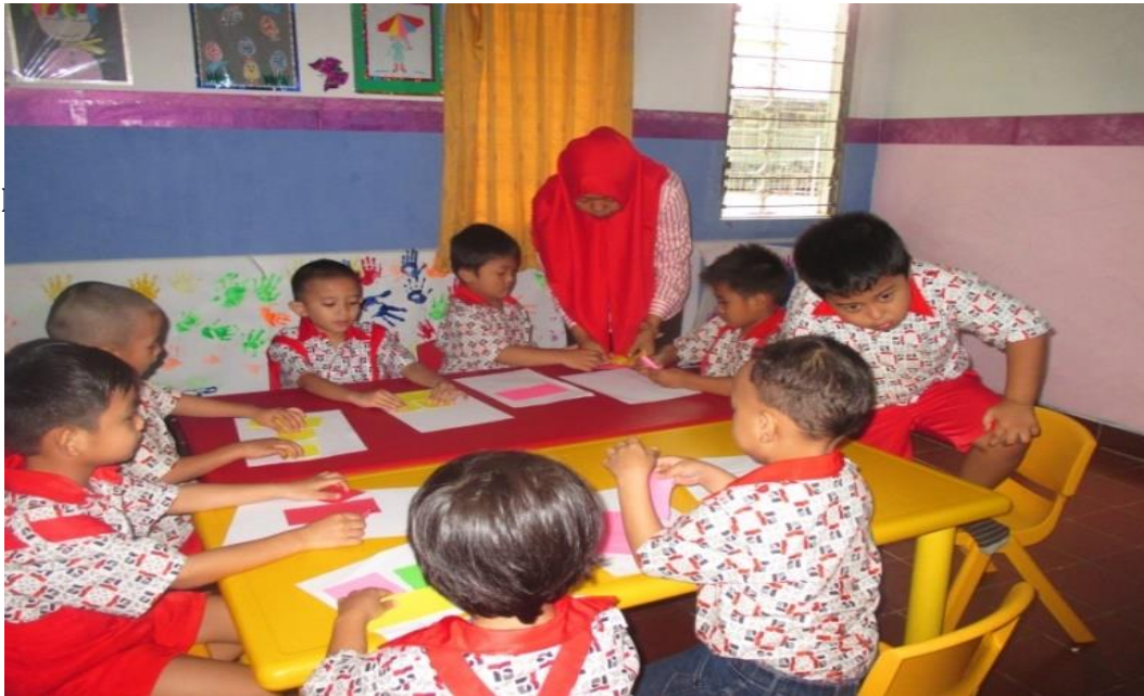
Pelaksanaan Kegiatan Melipat Kertas Bentuk Segitiga