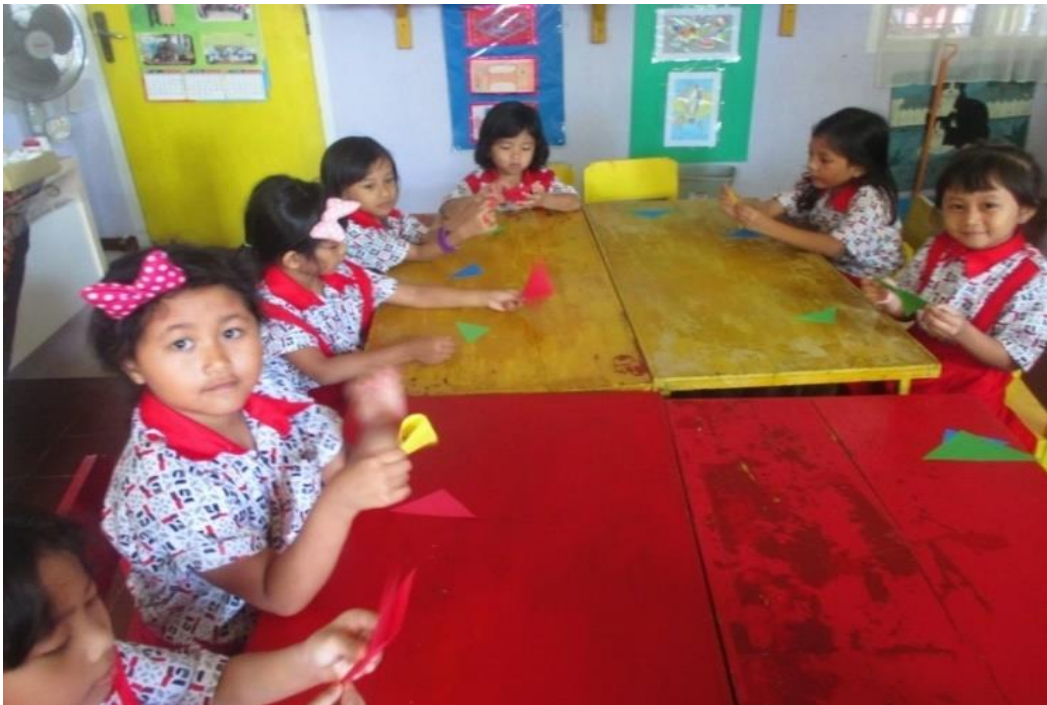
Kegiatan Melipat kertas