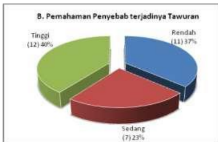
Gambar 3: Tingkat pemahaman penyebab terjadinya tawuran

Tingkat pemahaman mahasiswa terhadap terjadinya tawuran menurut diagram 2 dapat dijelaskan bahwa umumnya mahasiswa memiliki pemahaman yang tinggi yaitu sebanyak 12 orang atau sekitar 40%. Secara kuantitatif, angka ini menjadi umum dan bersifat generatif bahwa umumnya mahasiswa mengetahui perilaku tawuran baik dari segi gejala, modus, kelompok pelaku, dan kadang waktu-waktu terjadinya tawuran. Jika hal ini mampu teridentifikasi dengan baik, maka bukan tidak mungkin pendekatan yang strategis dalam mereduksi tawuran adalah melalui tindakan preventif dengan pemberian penguatan anti kekerasan dan gerakan tidak mudah terprovokasi.