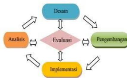
Gambar 1. Desain Pengembangan ADDIE

Model penelitian pengembangan Borg & Gall (2003) yang diadopsi dengan model Dick & Carey (2001) secara rinci memiliki lima tahap, yaitu: analisis kebutuhan, desain, pengembangan, evaluasi, dan implementasi yang sebenarnya merupakan tahap pengembangan ADDIE seperti dalam Gambar 1 berikut: