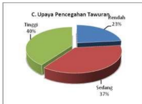
Gambar 4: Upaya pencegahan tawuran

Hal ini sejalan dengan kategori ketiga dari instrumen yang dikembangkan, yaitu upaya pencegahan tawuran melalui pembentukan gerakan anti kekerasan di kampus. Gerakan ini dalam kerangka pencegahan dan penguatan sejak awal pada mahasiswa agar memiliki resistansi yang kuat dalam menghadapi tindakan, ajakan dan provokasi negatif yang berpotensi terjadinya kekerasan yang berujung tawuran.