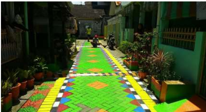
Gambar 7. Usulan konsep perbaikan jalan lingkungan sisi darat

Memperbaiki serta menata jalan yang ada dipermukiman kumuh khususnya wilayah darat, sesuai standar kelayakan dengan memberikan beberapa ornamen jalan baik yang bersifat pasif ataupun masif. Hal ini dapat dilakukan, dengan memberi lapisan pengerasan dengan hard material, misalnya dari paving blok, kemudian di sekitar rumah penduduk dilengkapi dengan pot bunga untuk menanam berbagai jenis bunga, sehingga suasana lingkungan menjadi hijau dan indah dipandang. Konsep ini dapat dilihat pada gambar 7.