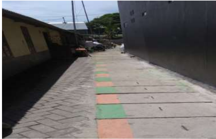
Gambar 11. Usulan sistem drainase tertutup