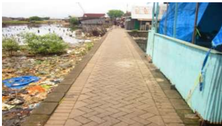
Gambar 5. Jalan setapak tanpa drainase di wilayah darat RT.008

Kondisi jaringan drainase lingkungan di Kelurahan Buloa secara keseluruhan terintegrasi dengan jaringan drainase kota. Namun pada RW 002 kawasan permukiman kumuh khususnya RT 008 yang merupakan perkampungan nelayan, kondisi drainase lingkungannya sangat buruk, termasuk wilayah darat yang ditempati penduduk. (Gambar 6) tetapi untuk wilayah perairan sama sekali tidak ada drainase lingkungan, karena hampir semua bangunan di lokasi tersebut didirikan di atas laut.