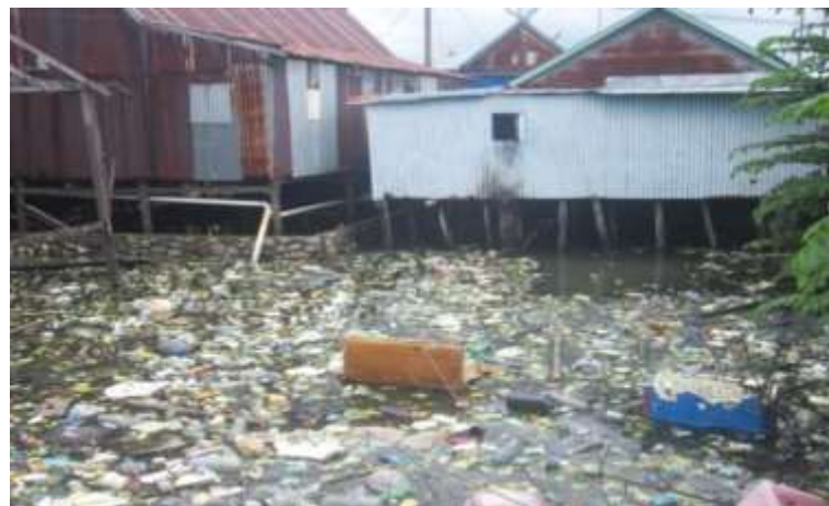
Gambar 3. Kondisi sampah di Belakang Pemukiman

Kesadaran masyarakat yang bermukim di wilayah perairan tentang kebersihan lingkungan, tergolong rendah sehingga mereka masih membuang sampah di sembarang tempat. Akibatnya, kondisi permukiman mereka menjadi kumuh akibat sampah yang berserakan di mana-mana. Contohnya seperti pada gambar di bawah ini.