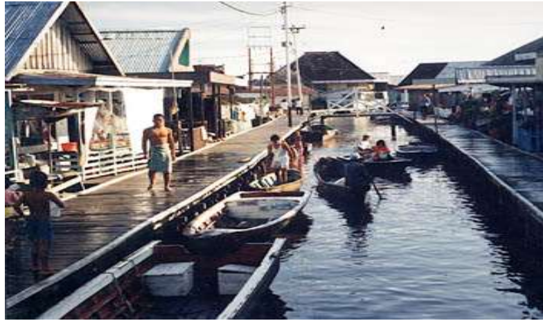
Gambar 8. Usulan konsep perbaikan jalan lingkungan sisi perairan

Untuk jalanan di pinggir laut sebaiknya dilengkapi dengan jalur hijau serta di sepanjang jalan disediakan tempat duduk atau spot di pinggir laut sehingga dapat menjadi vokal view yang menarik untuk objek wisata serta menjadi tempat tahanan perahu yang berada di pesisir laut. Selain itu, wilayah perairan yang kosong khususnya di celah-celah perumahan, sebaiknya ditanami pohon bakau sebagai penghijauan pantai, agar lingkungan yang kumuh berubah menjadi kawasan yang hijau.