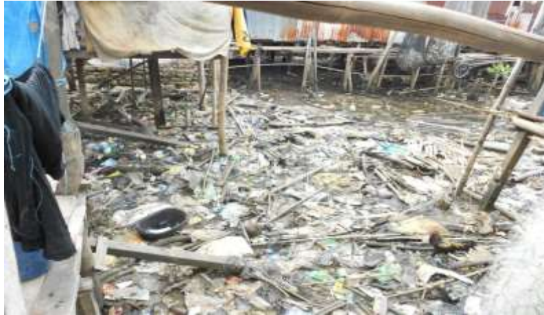
Gambar 4. Sampah berserakan di samping rumah

Hasil survey yang diperlihatkan pada gambar 4 dan 5 di atas, memperlihatkan betapa kumuhnya lingkungan perumahan di RW 002, khususnya RT.008 sebagai permukiman nelayan.