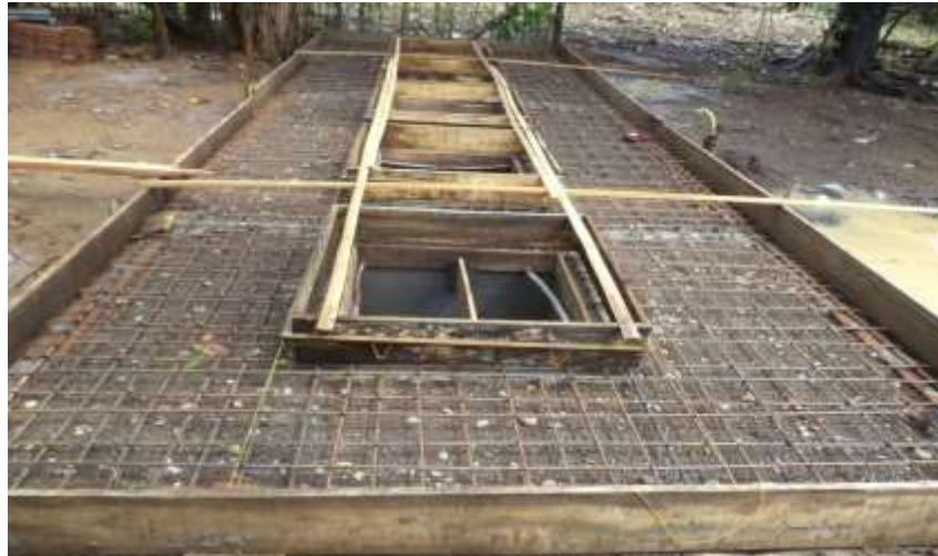
Gambar 13. Septictank induk dibangun di darat dan dihubungkan dengan pipa dengan kloset yang ada masing-masing rumah di perairan.