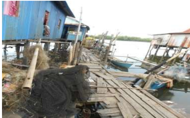
Gambar 2. Jalan Lingkungan Yang Menggunakan Kayu