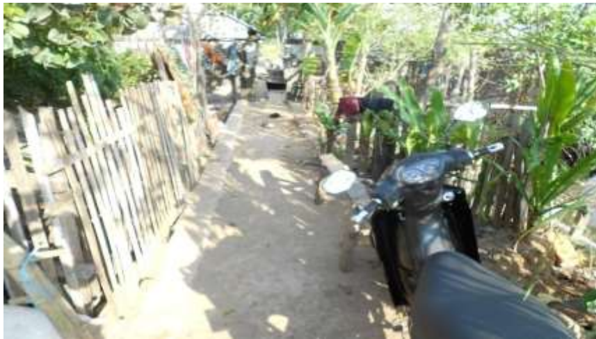
Gambar 1. Kondisi jalan lingkungan di Kelurahan Buloa

Berdasarkan hasil survey, panjang jaringan jalan lingkungan di di wilayah penelitian yaitu RW 002, sepanjang 609 km, dan khusus di perkampungan nelayan (RT.008), sepanjang 54 km dengan kondisi yang masih rusak dan juga dalam bentuk jalan kayu yang menghubungkan rumah penduduk.