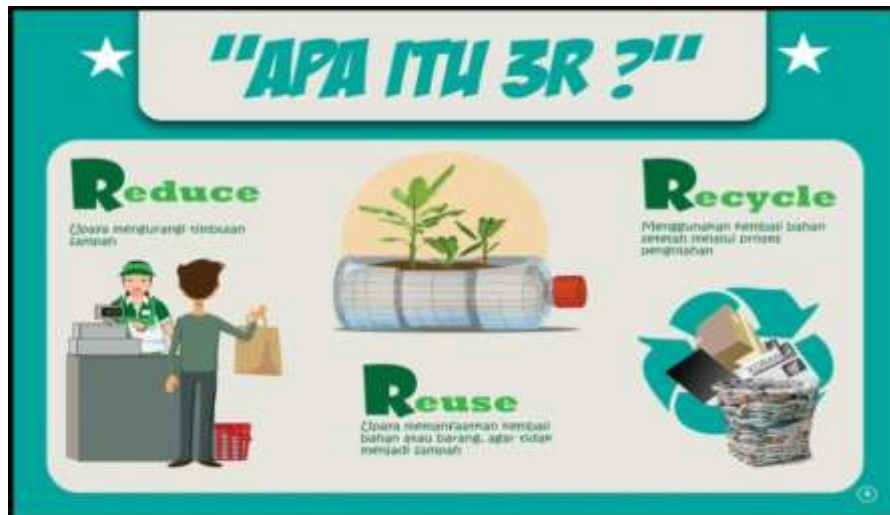
Gambar 10. 3 R (Reduce, Recycle, dan Reuse)