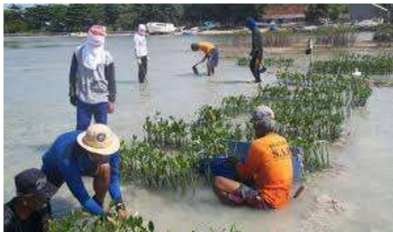
Gambar 9. Usulan konsep perbaikan lingkungan pantai dengan tanaman mangrove

Untuk jalanan di pinggir laut sebaiknya dilengkapi dengan jalur hijau serta di sepanjang jalan disediakan tempat duduk atau spot di pinggir laut sehingga dapat menjadi vokal view yang menarik untuk objek wisata serta menjadi tempat tahanan perahu yang berada di pesisir laut. Selain itu, wilayah perairan yang kosong khususnya di celah-celah perumahan, sebaiknya ditanami pohon bakau sebagai penghijauan pantai, agar lingkungan yang kumuh berubah menjadi kawasan yang hijau.