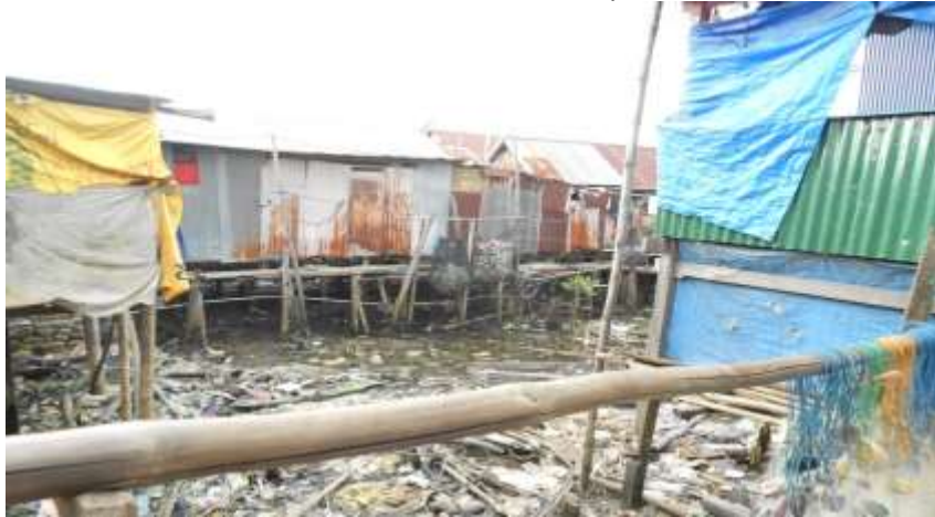
Gambar 6. Permukiman di atas perairan tanpa drainase di RT.008