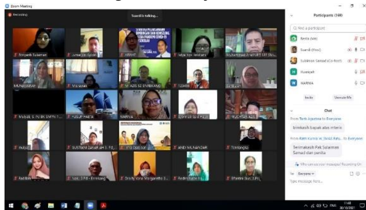
Gambar 1. Sesi Pelatihan