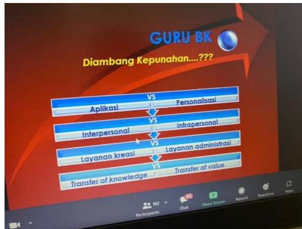
Gambar 2. Materi Pelatihan