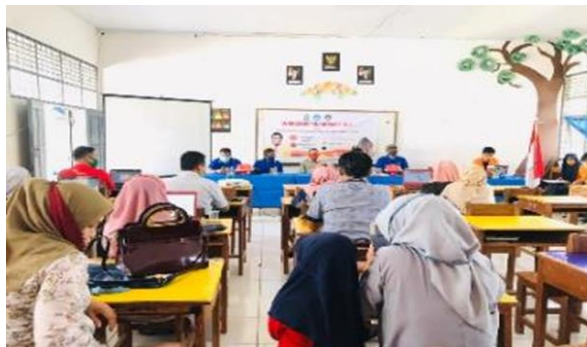
Gambar 3. Pamateri MIEE menyampaikan Workshop Microsoft office 365 kepada Guru-guru SMAN 9 Sinjai dan SDN 51 Lambari

Pada proses penyampaian materi terkait Microsoft office 365 , peserta workshop terlihat sangat antusias. Hal ini dibuktikan dengan banyaknya peserta yang bertanya pada pamateri terkait fitur-fitur microsoft 365 seperti langkah-langkah pembuatan kelas menggunakan fitur teams seperti terlihat pada gambar 3 berikut.