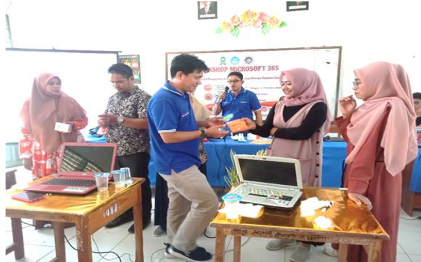
Gambar 4. Evaluasi Materi

Tahapan terakhir dalam rangkaian kegiatan adalah melakukan review dan evaluasi kegiatan. Diakhir kegiatan pemateri melaksanakan kegiatan evaluasi materi workshop Microsoft office 365 berupa quis menggunakan vitur Kahoot! Yang merupakan salah satu alat bantu belajar mengajar yang menyenangkan seperti dalam gambar 4 berikut.