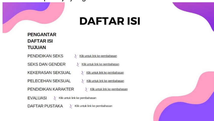
Gambar. 3 Daftar Isi