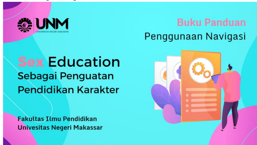
Gambar. 2 Buku Panduan