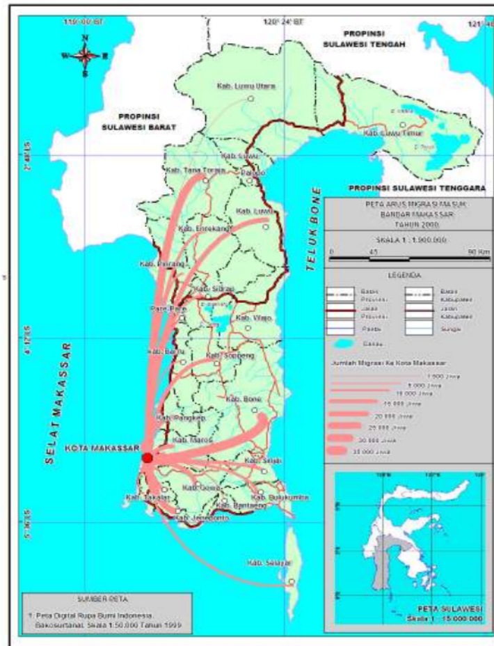
Rajah 2. Peta aliran migrasi masuk ke Bandar Makassar