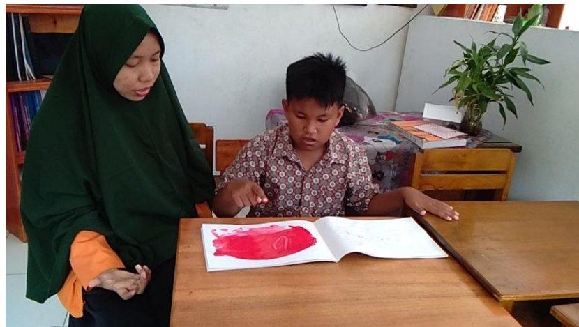
Tes kemampuan menulis (menulis huruf) diatas buku gambar yang terblocking tanpa bantuan peneliti pada murid autis kelas III di SLB Arnadya Makassar