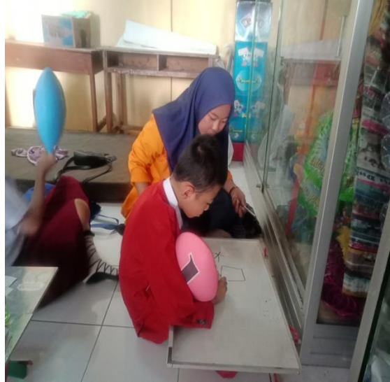
Tes kemampuan Keterampilan Menulis Permulaan pada siswa Autis Kelas II di SD Inpres Maccini Baru ( Baseline 2 (A2))