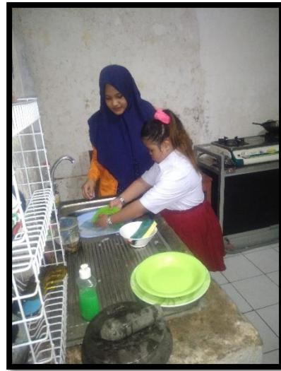
Tes keterampilan mencuci piring tanpa perlakuan setelah diberikan intervensi pada anak tunagrahita sedang kelas III di SLB-C YPPLB Cendrawasih Kota Makassar. (Baseline 2 (A2))