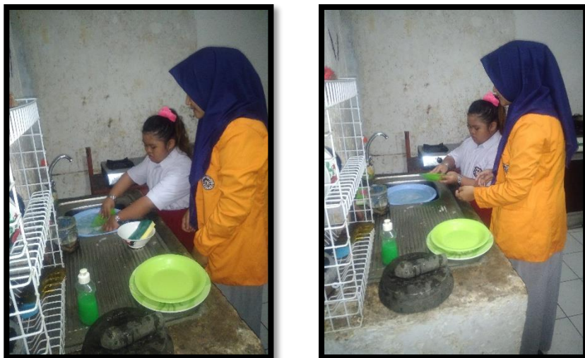
Tes keterampilan mencuci piring dengan memberikan perlakuan (Intervensi) pada anak tunagrahita sedang kelas III di SLB-C YPPLB Cendrawasih Kota Makassar. (Intervensi (B))