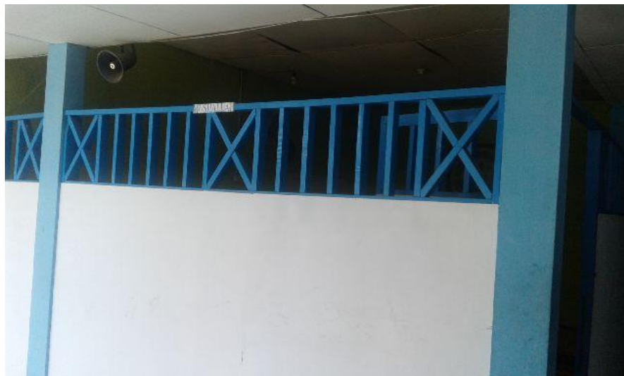
Gambar 6.8 Mushallah SLB YPAC Makassar