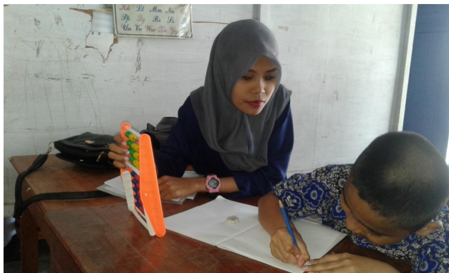
Gambar 6.2 Peneliti membantu guru untuk membimbing subyek belajar matematika dengan menggunakan alat peraga