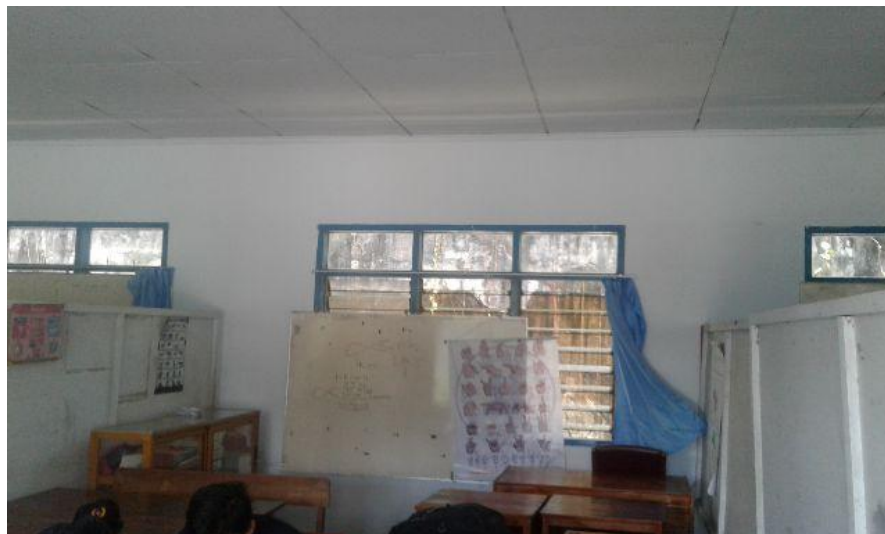
Gambar 6.12 Ruang Kelas III SDLB YPAC Makassar