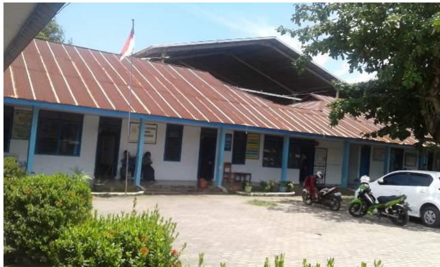
Gambar 6.10 Halaman SLB YPAC Makassar