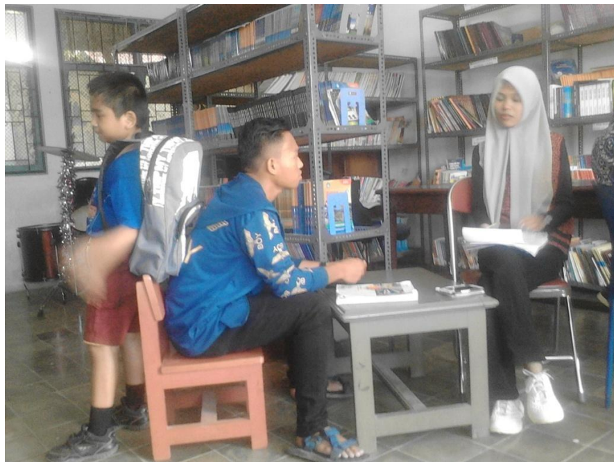
Gambar 6.4 Peneliti mewawancarai kakak subyek