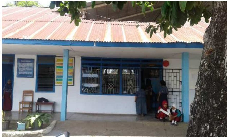
Gambar 6.7 Ruang Kepala Sekolah SLB YPAC Makassar