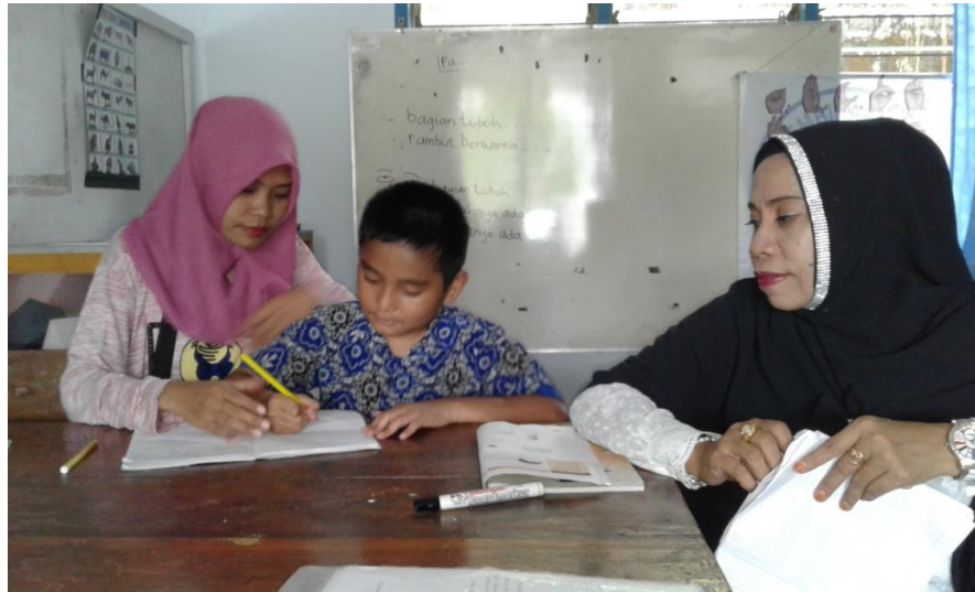
Gambar 6.1 Peneliti membantu guru untuk membimbing subyek belajar matematika