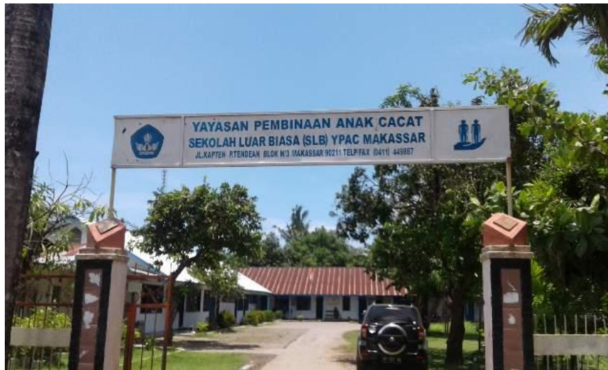
Gambar 6.6 Pintu gerbang SLB YPAC Makassar