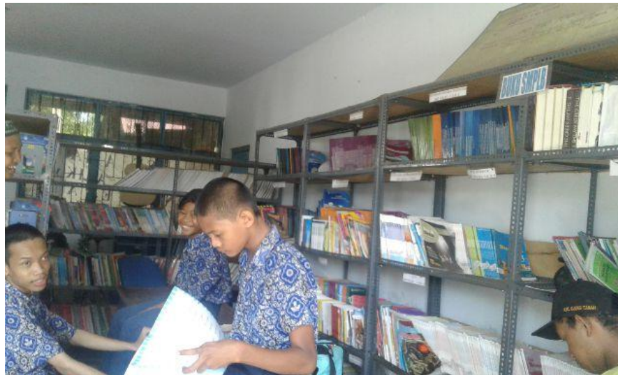
Gambar 6.9 Perpustakaan SLB YPAC Makassar