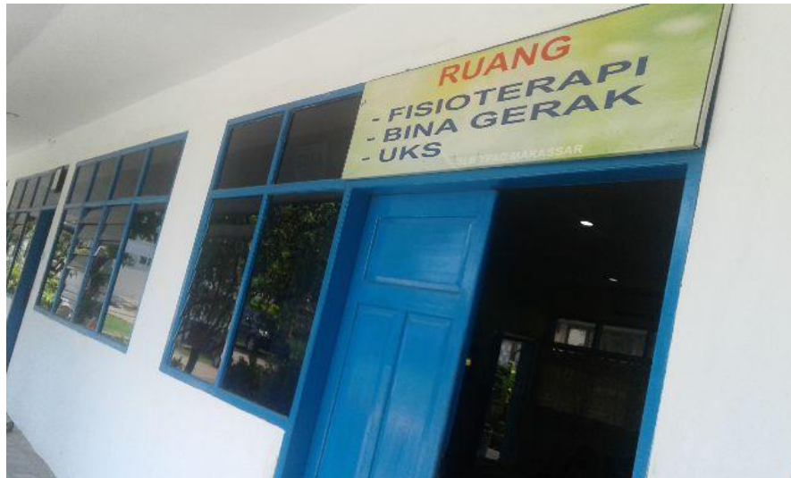
Gambar 6.11 Ruang terapi SLB YPAC Makassar