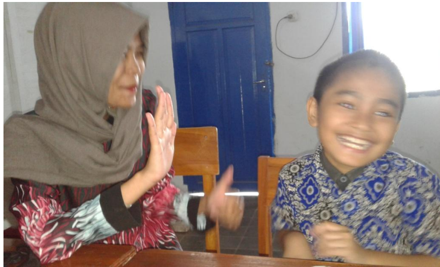
Gambar 6.5 Peneliti mewawancarai subyek