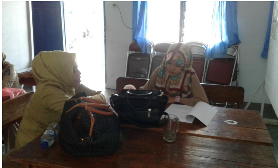
Gambar 6.3 Peneliti sedang mewawancarai guru kelas subyek