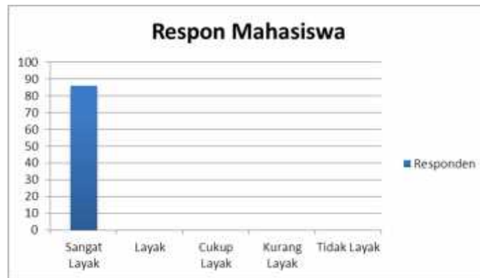
Gambar 3 Diagram Persentase Hasil Respon Mahasiswa

Berdasarkan tabel diatas dapat disimpulkan bahwa video ditinjau dari penilaian 15 mahasiswa dalam kategori keseluruhan indikator dari aspek penilaian pada media pembelajaran memperoleh hasil persentase 85,6% dengan dianggap “Sangat Baik”.