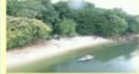
Pantai Birtaria Kassi Wisata Alam ; Kec. Tamalatea