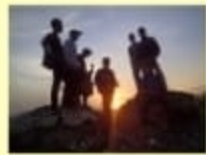
Bukit Toenga ; Wisata Alam Kec. Bangkala