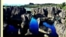
Batu Siping / Pondo Wisata Alam ; Kec. Bangkala Barat

JURUSAN GEOGRAFI FAKULTAS MIPA UNIVERSITAS NEGERI MAKASSAR 2021