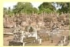
Makam Raja-Raja Binamu Wisata Budaya ; Kec. Bontoramba