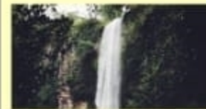
Air Terjun Boro Wisata Alam ; Kec. Rumbia