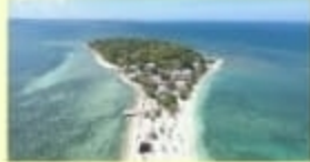
Puleu Libukang Wisata Alam ; Kec. Bangkala