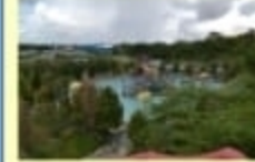
Water Park Boyong Wisata Budaya ; Kec. Tamalatea