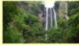
Air Terjun Tama'lulus Wisata Alam ; Kec. Rumbia