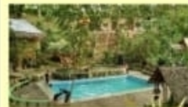
Lembah Hijau Rumbia Wisata Alam ; Kec. Rumbia