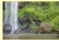
Air Terjun Lembah Impian Wisata Alam ; Kec. Rumbia