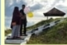
Pantai Karsut Wisata Alam ; Kec. Arungkeke