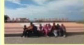
Pantai Tamarunang Wisata Alam ; Kec. Binamu