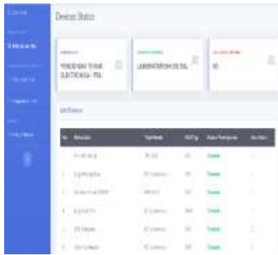
Gambar 9. Rancangan Website 1