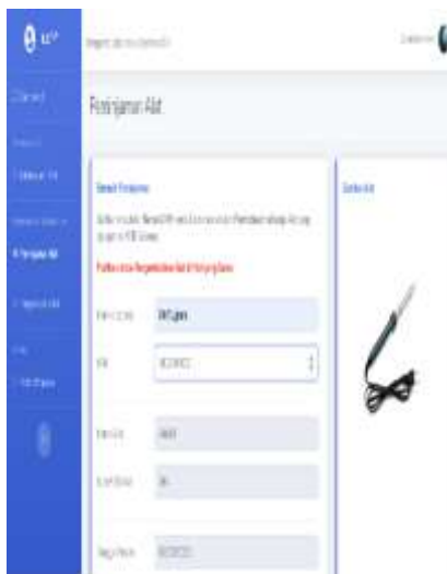
Gambar 10. Rancangan Website 2