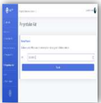
Gambar 13. Pengujian Pengembalian Barang

Pengujian pengembalian barang ini bertujuan untuk menguji coba sistem website yang telah dirancang oleh penulis dan bisa berfungsi sebagaimana mestinya. Pada bagian pengembalian ini sangat dibutuhkan untuk memverifikasi apakah benar barang yang telah dipinjam sama dengan barang yang akan dikembalikan ke admin.