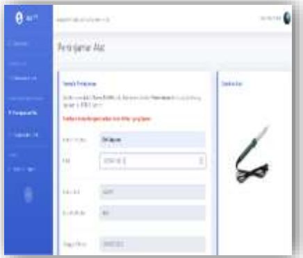
Gambar 12. Pengujian Peminjaman Alat

Hasil pengujian ini dilakukan untuk mengecek apakah website sudah tersinkron dengan database yang dibuat.