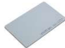
Gambar 1. RFID Tag

adalah sebuah piranti yang menempel terhadap objek yang diidentifikasi oleh RFID Reader dan mempunyai ID yang berbeda-beda.