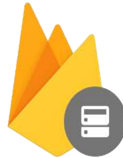
Gambar 5. Firebase Realtime Database

dan menerima update data yang terbaru secara otomatis.