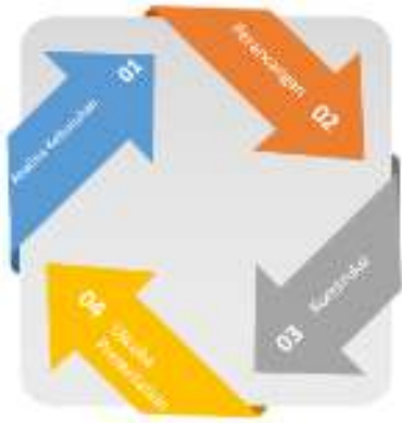
Gambar 6. Kerangka Konseptual Penelitian

Agar penelitian yang dilakukan dapat berjalan dengan baik, maka diperlukan perencanaan disetiap akan melakukan kegiatan.