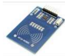
Gambar 2. RFID Reader

Reader RC522 adalah sebuah perangkat yang berfungsi untuk membaca ID pada tag RFID.