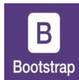
Gambar 3. Bootstrap

Adalah library Framework CSS yang dikhususkan untuk pengembangan front-end dari suatu website. Library memiliki beberapa jenis file diantaranya HTML, CSS, dan Javascript.