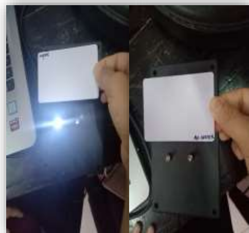
Gambar 11. Pengujian Indikator

Dari hasil pengujian led dan buzzer, dapat disimpulkan ketika RFID tag didekatkan atau ditempel ke reader maka rangkaian led dan buzzer akan aktif, dan sebaliknya ketika tag tidak sedang proses scan data maka rangkaian led dan buzzer tidak aktif.