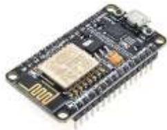
Gambar 4. NodeMCU ESP8266

Adalah platform IoT sifatnya yang opensource dan dilengkapi dengan WiFi.