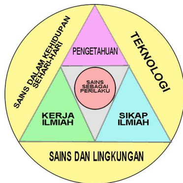
Gambar 1. Kerangka Pengembangan Ilmu Pengetahuan Alam

Gambar 1. di atas menunjukkan bahwa peserta didik mampu menerapkan kompetensi Ilmu Pengetahuan Alam yang dipelajari di sekolah menjadi perilaku dalam kehidupan masyarakat dan memanfaatkan masyarakat dan lingkungan sebagai sumber belajar.