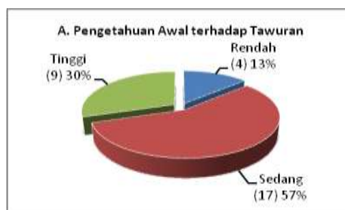
Gambar 2: Pemahaman awal mahasiswa terhadap tawuran

Secara umum jika dideskripsikan secara kuantitatif, persentasi ketiga kategori yang meliputi: persepsi awal terhadap tawuran, pemahaman penyebab terjadinya tawuran, dan upaya pencegahan tawuran dapat disajikan dalam tiga indikator tinggi, sedang, dan rendah. Hasil analisisnya disajikan dalam diagram berikut: