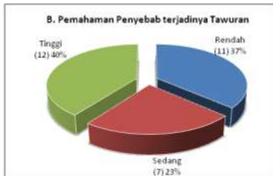
Gambar 3: Tingkat pemahaman penyebab terjadinya tawuran

Tingkat pemahaman mahasiswa terhadap terjadinya tawuran menurut diagram 2 dapat dijelaskan bahwa umumnya mahasiswa memiliki pemahaman yang tinggi yaitu sebanyak 12 orang atau sekitar 40%. Secara kuantitatif, angka ini menjadi umum dan bersifat generatif bahwa umumnya mahasiswa mengetahui perilaku tawuran baik dari segi gejala, modus, kelompok pelaku, dan kadang waktu-waktu terjadinya tawuran. Jika hal ini mampu teridentifikasi dengan baik, maka bukan tidak mungkin pendekatan yang strategis dalam mereduksi tawuran adalah melalui tindakan preventif dengan pemberian penguatan anti kekerasan dan gerakan tidak mudah terprovokasi.