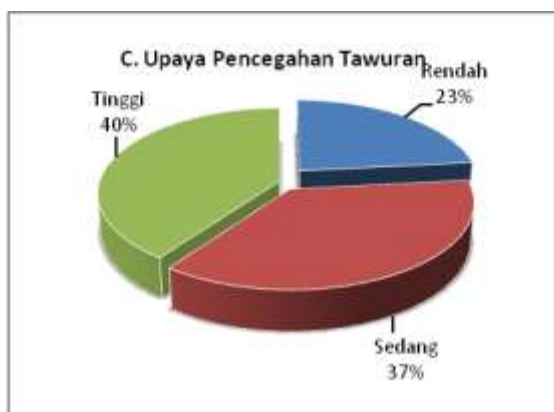
Gambar 4: Upaya pencegahan tawuran

Hal ini sejalan dengan kategori ketiga dari instrumen yang dikembangkan, yaitu upaya pencegahan tawuran melalui pembentukan gerakan anti kekerasan di kampus. Gerakan ini dalam kerangka pencegahan dan penguatan sejak awal pada mahasiswa agar memiliki resistansi yang kuat dalam menghadapi tindakan, ajakan dan provokasi negatif yang berpotensi terjadinya kekerasan yang berujung tawuran.