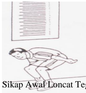
Gambar 3.4. Sikap Awal Loncat Tegak